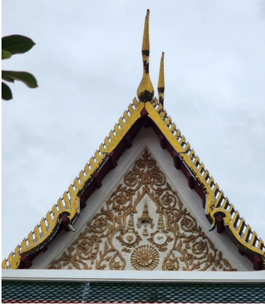
หน้าบันอุโบสถ

จุดสำคัญหน้าบันอุโบสถวัดมหาสมณารามที่ยอกให้เห็นความสวยงาม ความสำคัญ ประวัตืและความเป็นมาที่เกี่ยวข้องกับพระจอมเกล้าเจ้าอยู่หัวด้านทิศตะวันออกประดับลายปูนปั้นรูปพระมหากษัตริย์มณฑลราชธานีด้วยฉัตรพร้อมด้วยกระต่ายและนกยูง ทิศนคตที่นกยูงเปรียบเสมือนพระอาทิตย์และกระต่ายเสมือนพระจันทร์อุโบสถวิหารเหมือนสรวงสวรรค์ชั้นที่พระพุทธเจ้าประทับอยู่