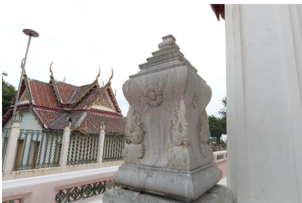
เสมาอุโบสถ

เสมาอุโบสถวัดมหาสมณาราม เป็นหินอ่อนหลักทรงสี่เหลี่ยมตามแบบนิยมสมัยรัชกาลที่ 4