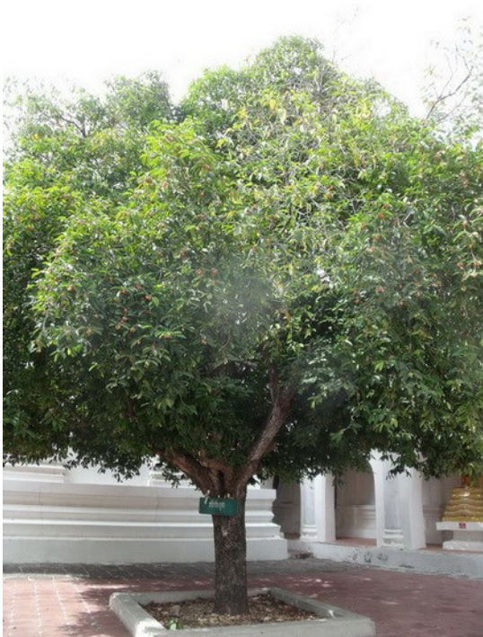
ลักษณะทรงพุ่ม