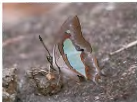
ผีเสื้อเหลืองหนามธรรมดา Polyura athamas (Drury)