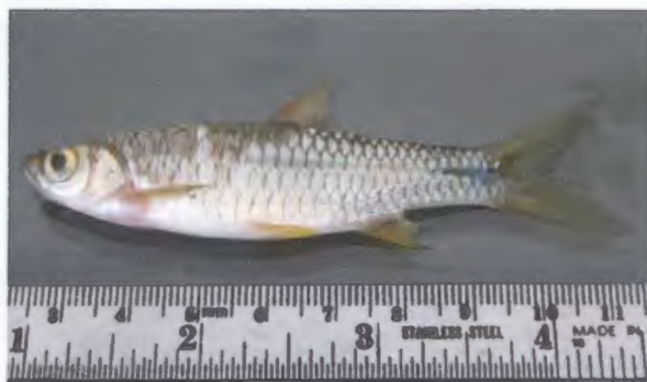
จิวกวายแถบดำ Rasbora paviei