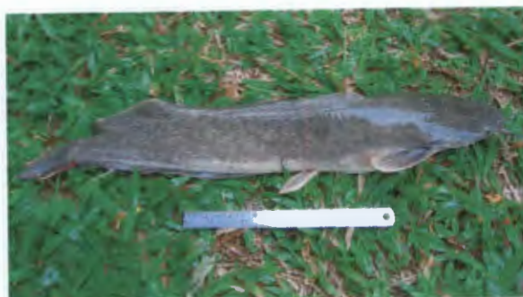
ตุ๊กบักอูย Clarias gariepinus