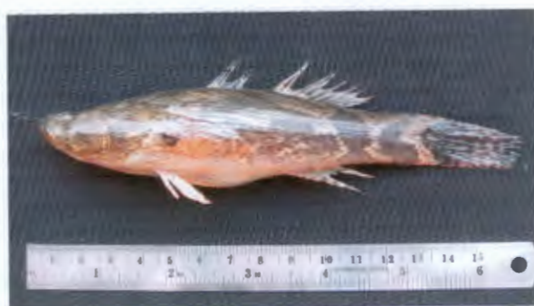
นุ่ทราย Oxyleotris marmoratus