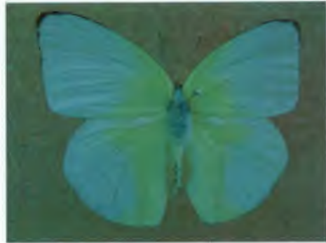
ผีเสื้อหนอนกุน Catopsilia pomona Fabricius