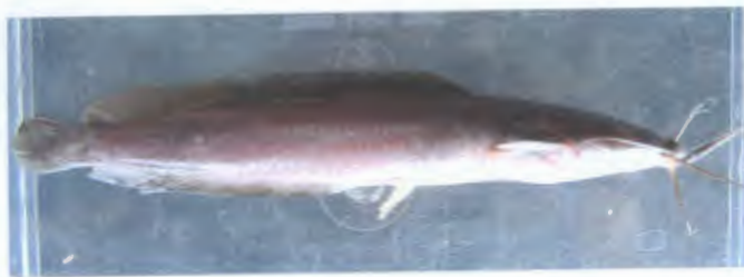
ตุ๊กต๋าน Clarias batrachus