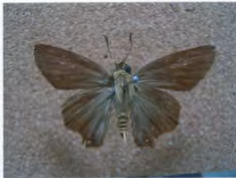
ผีเสื้อหน้าเข็มสีตาล Badamia exclamacionis Fabricius