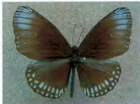
ผีเสื้อจรกาหนอนยี่โด Euploea core Lucus