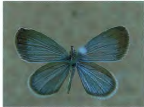
ผีเสื้อกลุ่มสีน้ำเงิน Zizula hylax (Fabricius)