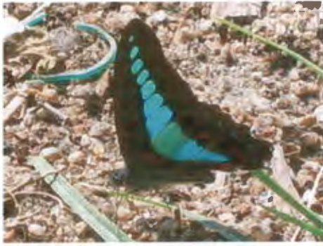
ผีเสื้อสะพายฟ้า