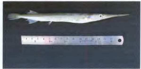
กระตู่เทว