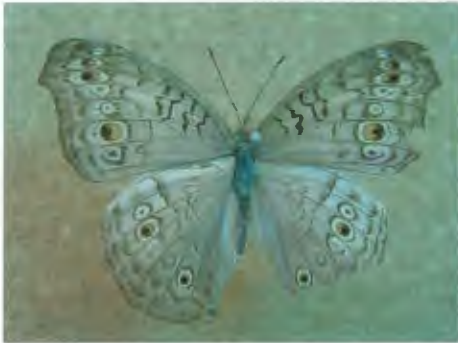
ผีเสื้อแพนซีเทา