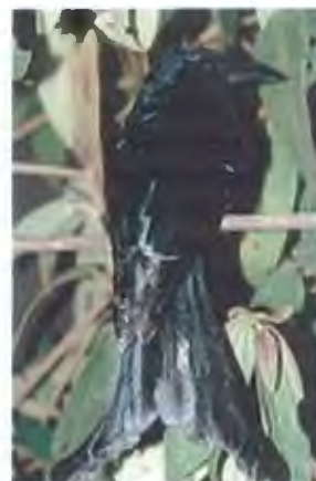
นกแขวงแขวเล็กเหลือบ