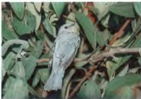
นกจับแมลงสีฟ้า Eumyias thalassina (Swainson, 1838)