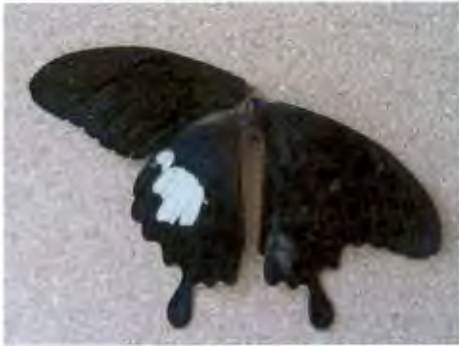
ผีเสื้อหางติ่งชะอ้อน