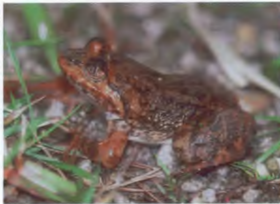
กบหัวขานปม

Leptolalax pelodytoides (Boulenger, 1893)