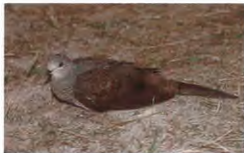
นกเขาลายใหญ่