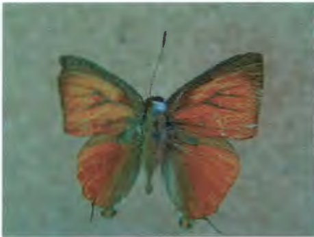
ผีเสื้อหนอนไม้ผลแดงธรรมดา Rapala iarbus (Fabricius)