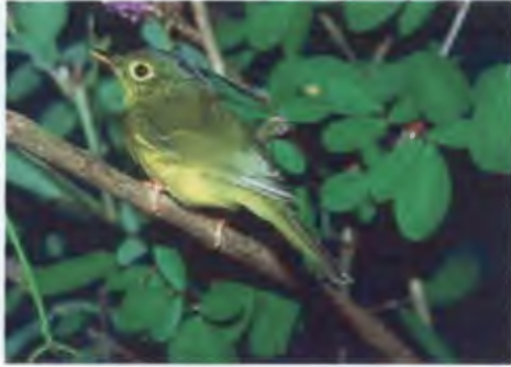
นกกะจ้อยวงตาสีทอง