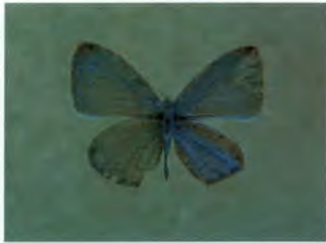
ผีเสื้อฟ้าพุ่ม Celastrina lavendularis (Moore)