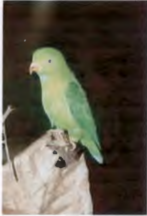
นกหกเล็กปากแดง