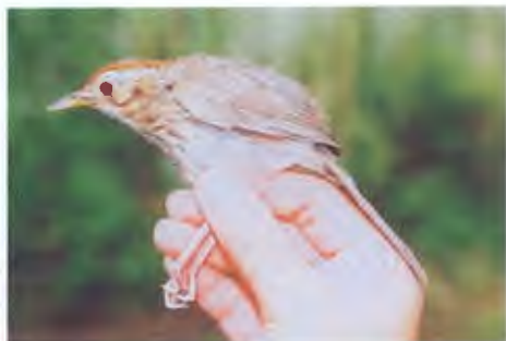
นกจาบดินอกลาย