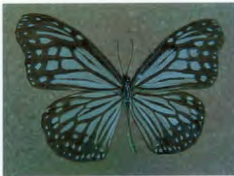
ผีเสื้อหนอนใบรักขี้ดียว Parantica aglea Moore