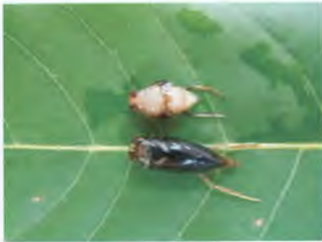
มวนวน วงศ์ Notonectidae