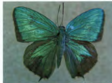
ผีเสื้อกลุ่มฟ้าไม้ก้อ Arthropala eumolphus (Cramer)