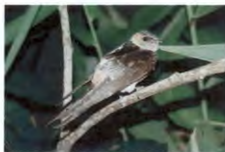
นกนางแอ่นตะโพกแดง