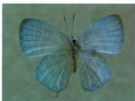
ผีเสื้อฟ้าขาวสีต่างฤดู Jamides celeno Fabricius