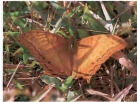
ผีเสื้อตาลหางแหลมธรรมดา