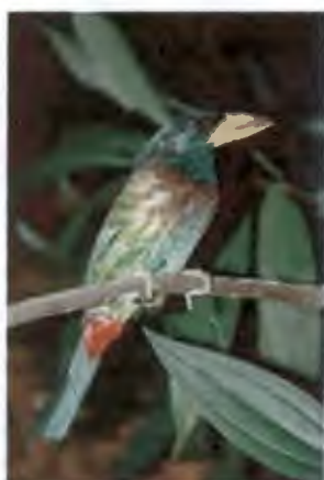
นกตั้งล้อ