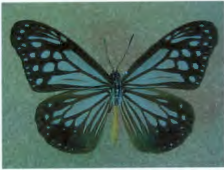
ผีเสื้อหนอนใบรักสีตาล