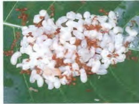
มดแดง วงศ์ Formicidae