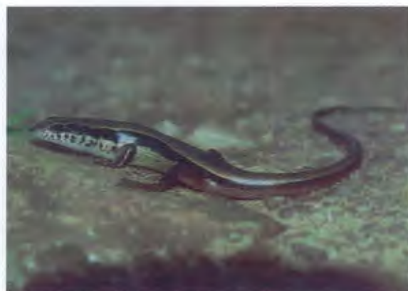
จิ้งเหลนภูเขาอินเดีย