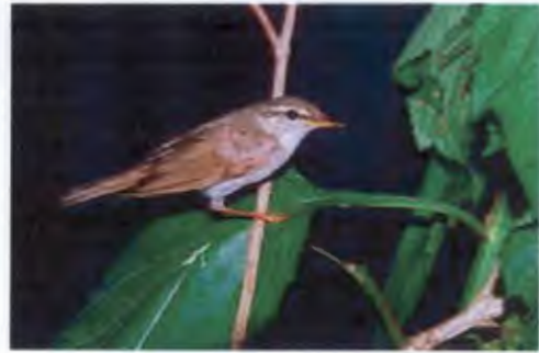
นกกะจืดหัวโลกเหนือ