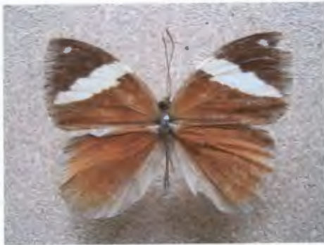
ผีเสื้อตาลแถบเหลือง