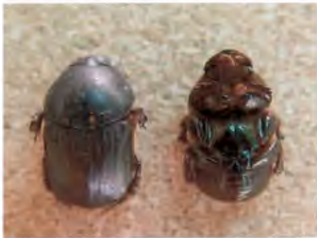
ด้วงคางคกเขียว วงศ์ Scarabaeidae