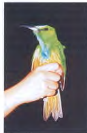
นกจาบคาเคราน้ำเงิน Nyctornis ethertoni (Jardine-Selby, 1830)