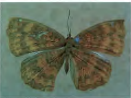
ผีเสื้อหนอนละหุ่งธรรมดา