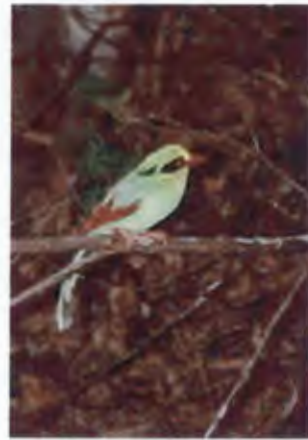
นกสาลิกาเขียว