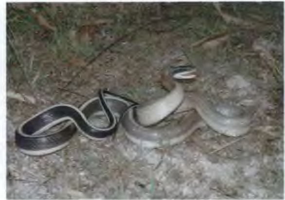
งูบาทมหากหางนิล