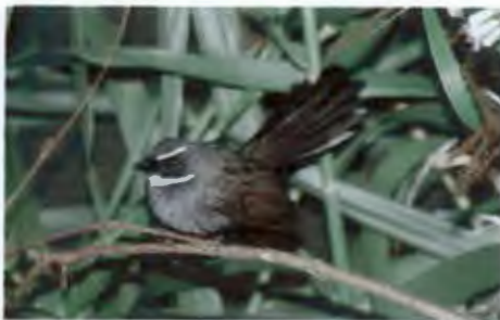
นกอีแพรดคอขาว