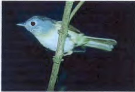
นกมุ่นรกตาแดง