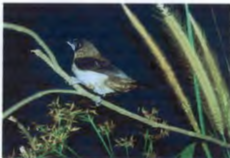
นกกะตีดตะโพกขาว