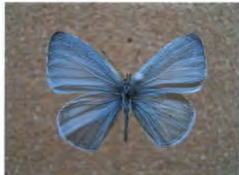
ผีเสื้อฟ้าพุ่มขอบปีกจาง Udara dilecta Moore