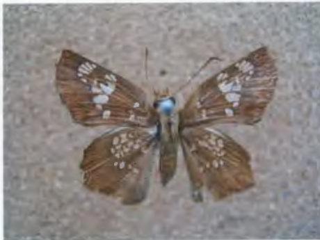
ผีเสื้อกลุ่มบินเร็ว