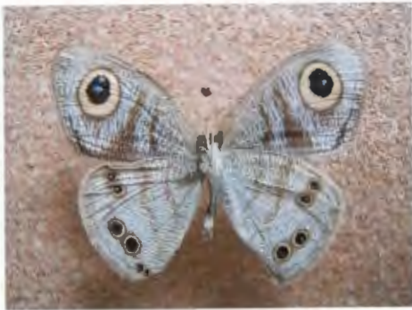
ผีเสื้อตาลจุดตาห้าธรรมดา (ด้านท้อง)