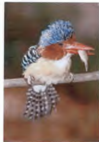
นกกะเต็นลาย