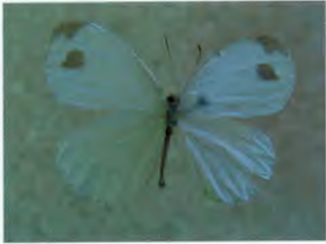
ผีเสื้อขาวแคระ