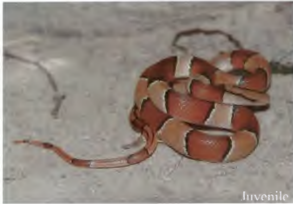
งูทางมะพร้าวแดง