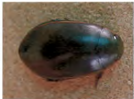
ด้วงดิ่ง วงศ์ Dytiscidae