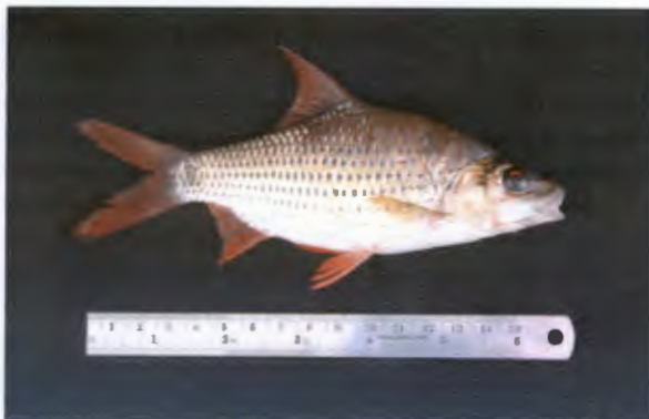
ไต้ต้นตาแดง