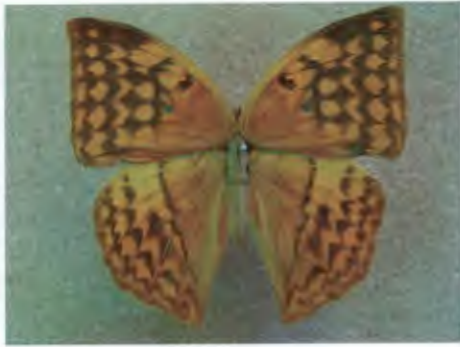
ผีเสื้อกลุ่มนางพญา Enispe euthymius Brooks