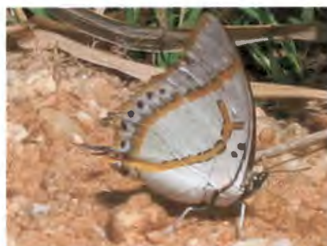
ผีเสื้อเหลืองหนามใหญ่โคนปีกดำ Polyura eudamippus (Doubleday)