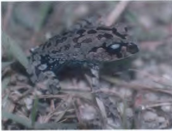
อึ่งกราย sp.1