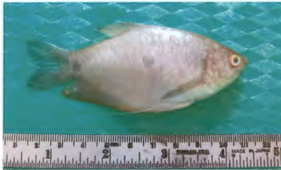
กระดี่หม้อ