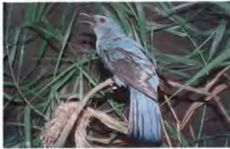
นกเขียวคราม Irena puella Latham, 1790