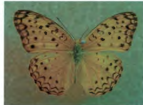
ผีเสื้อเสือดาวใหญ่