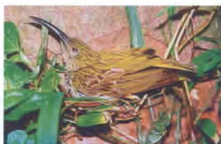
นกปลีกล้วยลาย