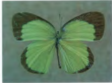
ผีเสื้อเนรจิ๋ว