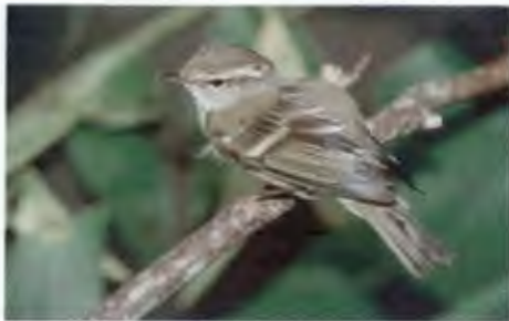
นกกะจืดเขียวปีกสองแถบ

Phylloscopus plumbeitarsus Swinhoe, 1861