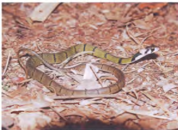
งูลายสบบเขียวขวั้นดำ