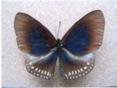
ผีเสื้อจรกา Euploea midamus (Guérin-Ménéville)