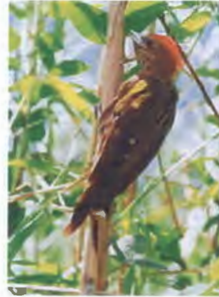
นกหัวขวานป่าไผ่