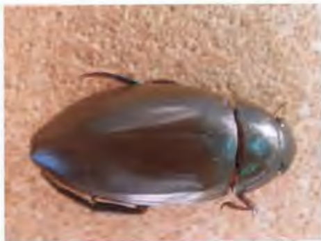
แมลงเหนียง วงศ์ Hydrophilidae