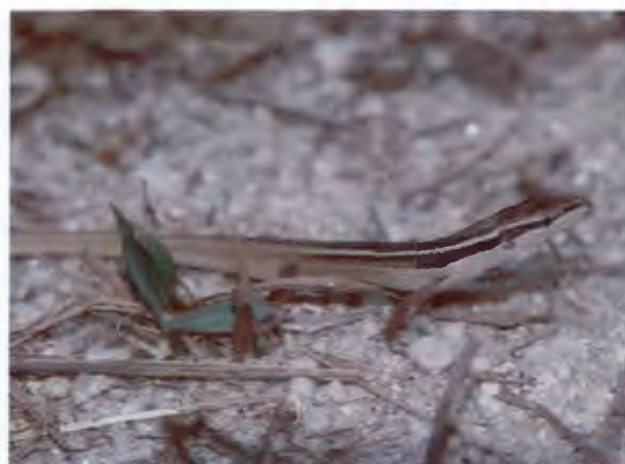
กิ้งก่าน้อยหางยาว