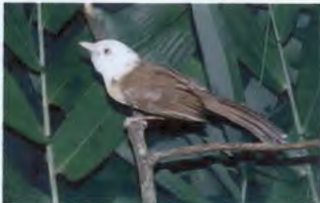
นกเสื่อแมลงหัวขาว