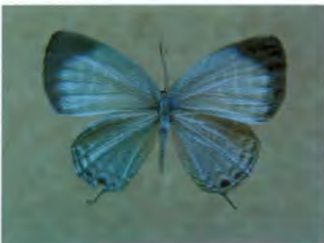
ผีเสื้อฟ้าขาวปีกโต Jamides pura (Moore)