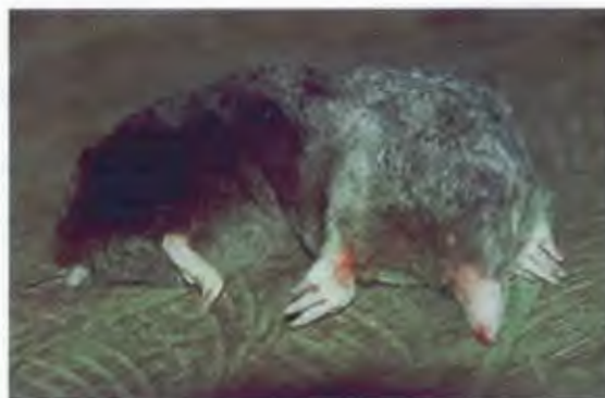
ตุ่น หรือ ติ่ง