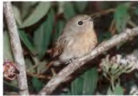
นกจับแมลงคอน้ำตาลแดง Cyornis banyumas (Horsfield, 1821)