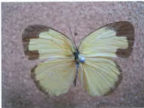
ผีเสื้อเนรธรรมดา