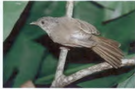
นกมุ่นรกตาขาว