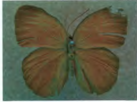
ผีเสื้อป่าสีตาลไหม้ Faunis canens Stichel