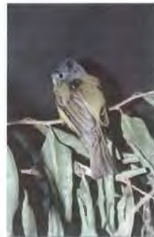
นกจับแมลงหัวเทา Culicicapa ceylonensis (Swainson, 1820)