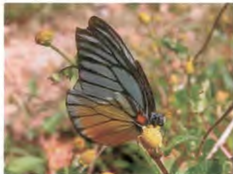
ผีเสื้อรอบปีกเลื่อยจุดแดง