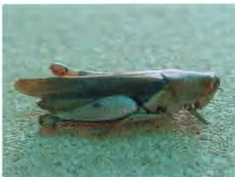
ตั๊กแตนขาแดง วงศ์ Acrididae