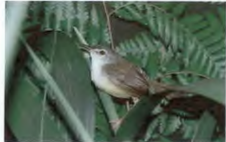
นกกะจิบหญ้าท้องเหลือง

Phylloscopus plumbeitarsus Swinhoe, 1861