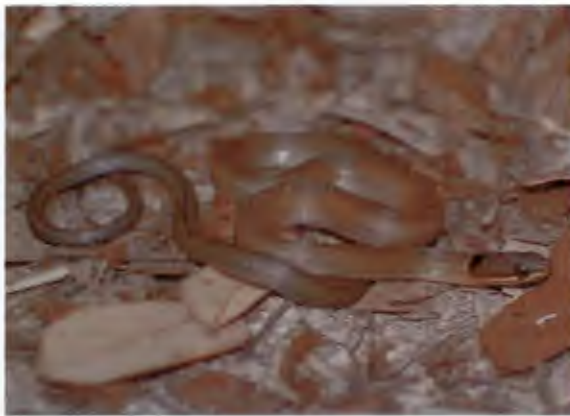
งูคอขวั้นดำ