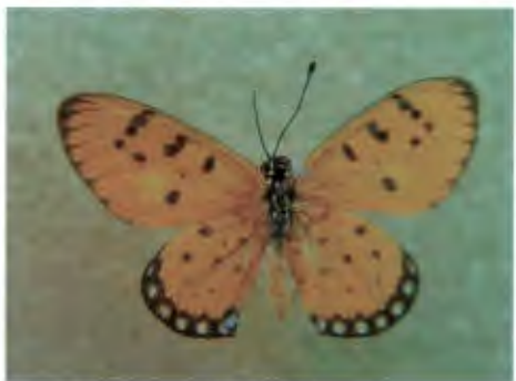
ผีเสื้อหนอนหนามกะทกรก