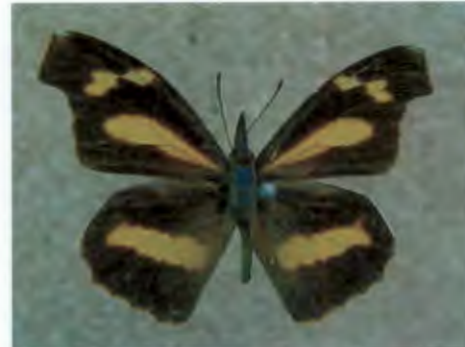
ผีเสื้อหัวแหลมกระบอง Libythea myrrha Fruhstorfer