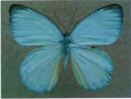
ผีเสื้อหนอนกาฝากจุดแดง Delias descombesi Boisduval