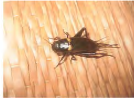
จิ้งหรีดทองดำ วงศ์ Gryllidae