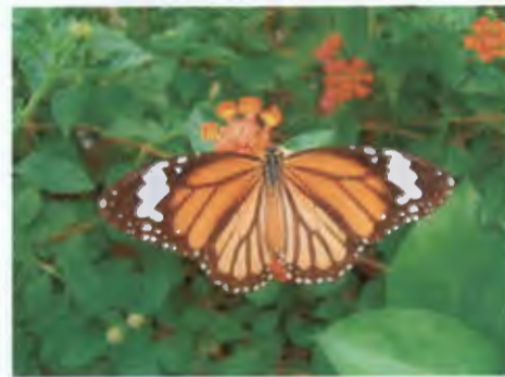
ผีเสื้อหนอนใบรักลายเสือ Danaus genutia (Cramer)