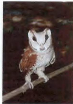
นกแสกแดง