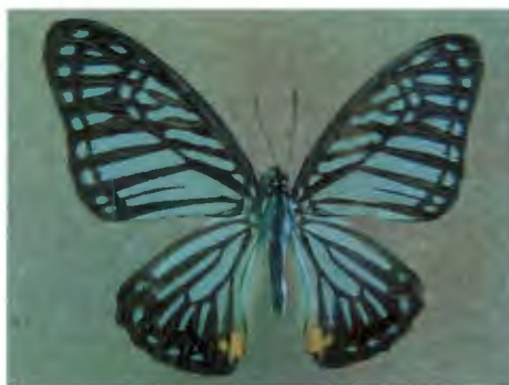
ผีเสื้อม้าลายใหญ่ Graphium xenocles Fruhstorfer