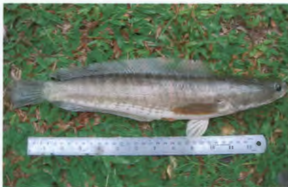
ช่อน Channa striatus