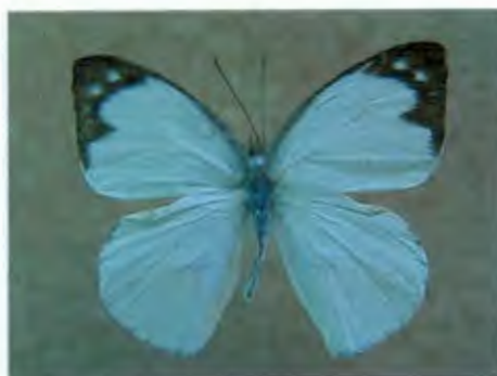
ผีเสื้อหนอนใบกุ่มอินทรา Appias indra Fruhstorfer