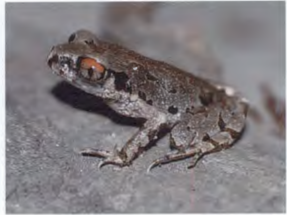
อึ่งกรายหนังปม

Leptolalax pelodytoides (Boulenger, 1893)