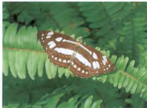
ผีเสื้อกะลาสีธรรมดา Nepis hylas Moore