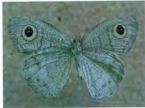
ผีเสื้อตาลจุดตาห้าสีจาง (ด้านท้อง)