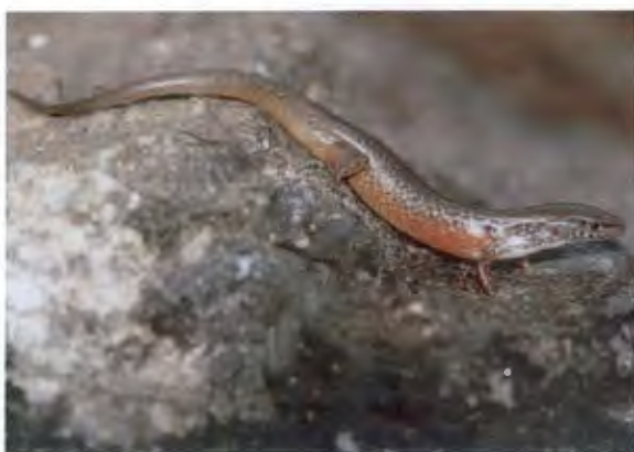
จิ้งเหลนดิน

Hemidactylus frenatus Dumeril and Bibron, 1836