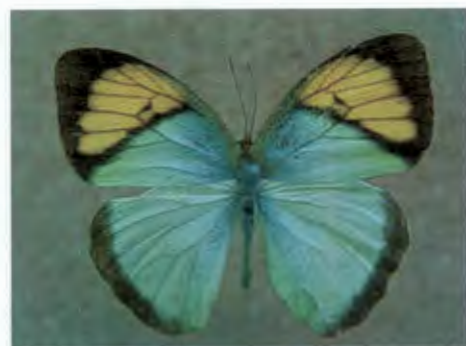
ผีเสื้อปลายปีกส้มเล็ก