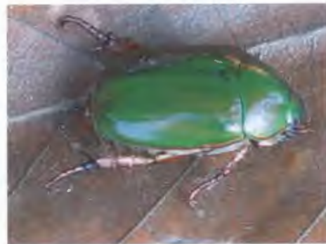
แมลงนูนเขียวธรรมดา วงศ์ Scarabaeidae