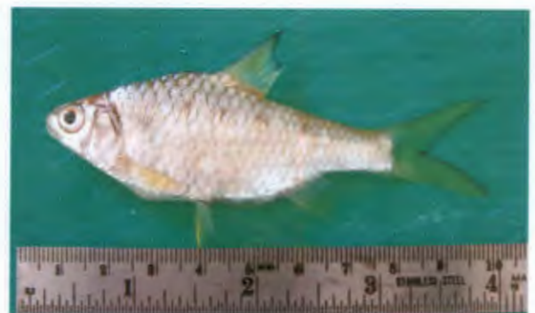
หนามหลัง