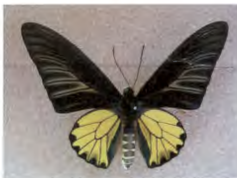
ผีเสื้อถุงทองธรรมดา Troides aecus (C. and R. Felder)