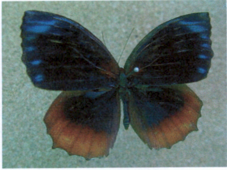
ผีเสื้อหนอนมะพร้าวธรรมดา