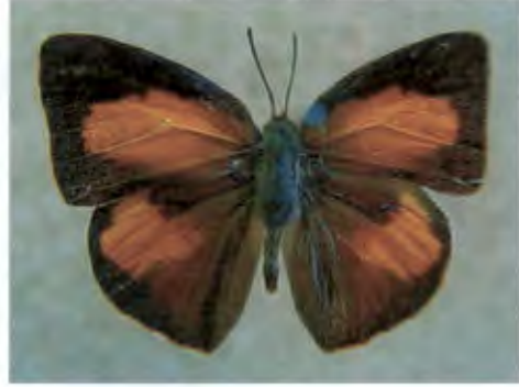
ผีเสื้อกลุ่มสีน้ำเงิน Curetis bulis (Westwood)