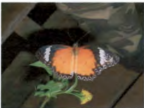
ผีเสื้อกะทกรกแดง Cethosia biblis (Drury)