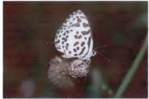
ผีเสื้อหนอนพุทราธรรมดา Castalius rosimon Fabricius