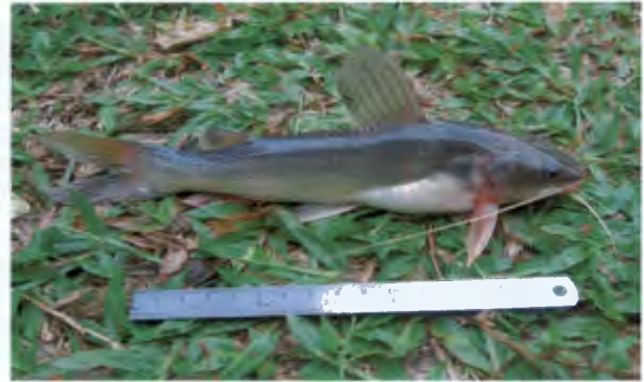
กตเหลือง