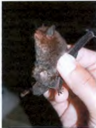
ค้างคาวหูหนוטินเล็กเขี้ยวยาว