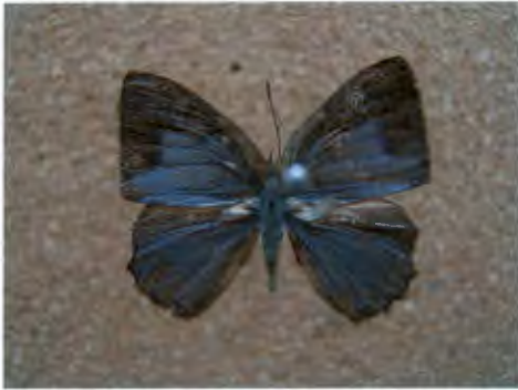
ผีเสื้อกลุ่มมรกต Poritia phama