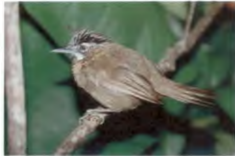
นกกินแมลงคอเทา