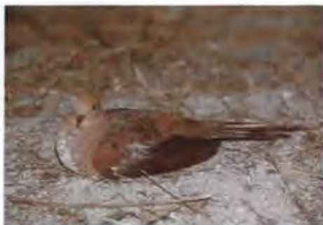
นกเขาลายเล็ก