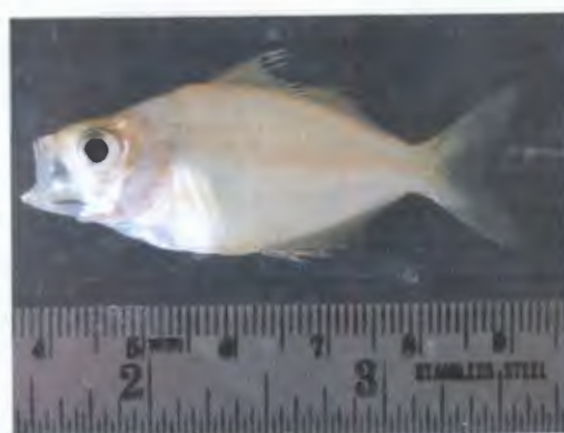
แป้นแก้ว Parambassis siamensis