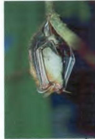
ค้างคาวจุมกตลอดหูสั้น