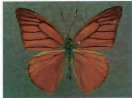
ผีเสื้อหนอนใบกุ่มเนโร Appias nero Wallace