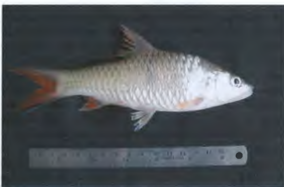
กระสุมขีด