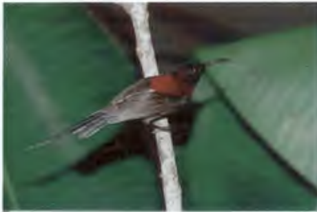
นกกินปลีหางยาวคอดำ