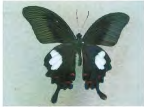
ผีเสื้อหางติ่งเฮเลน