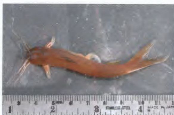
ดัก Amblyceps ferotum