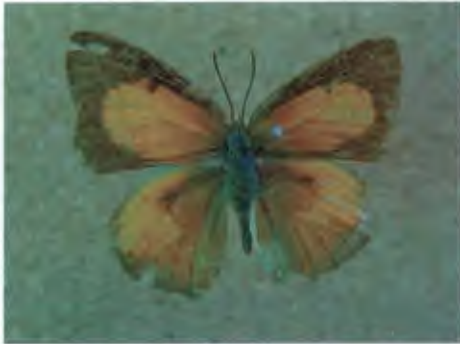
ผีเสื้อสีหมากสุก Curetis dentata Moore