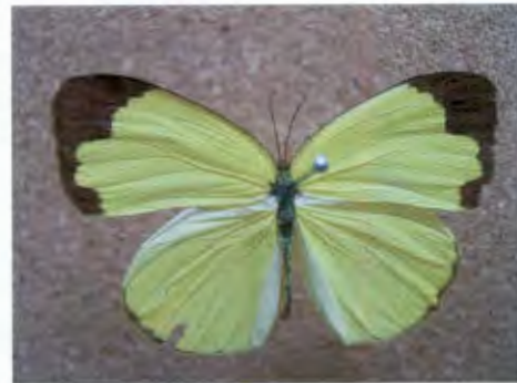
ผีเสื้อเนรสามจุด