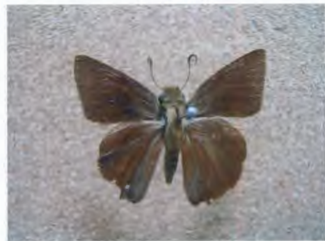
ผีเสื้อกลุ่มหน้าเข็ม