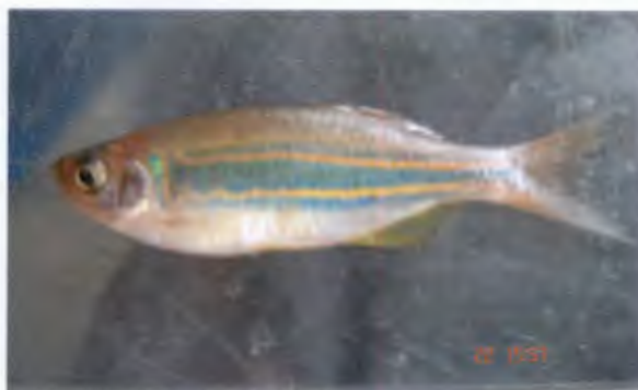
จิวกใบไม้ Danio regina