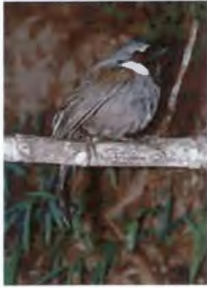
นกกระรางคอดำ/นกชอชู้