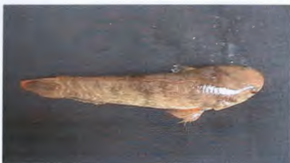
ก้าง Channa gachua