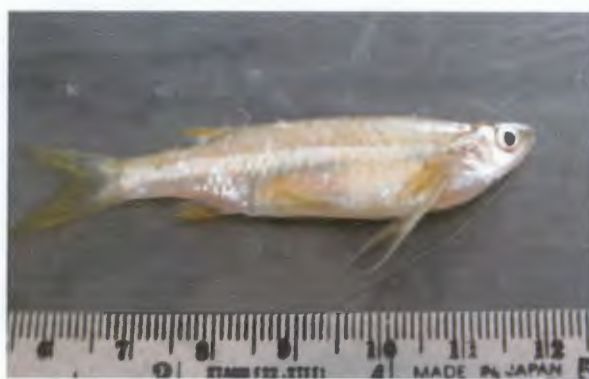
จิวกหนวดยาว Esomus metallicus