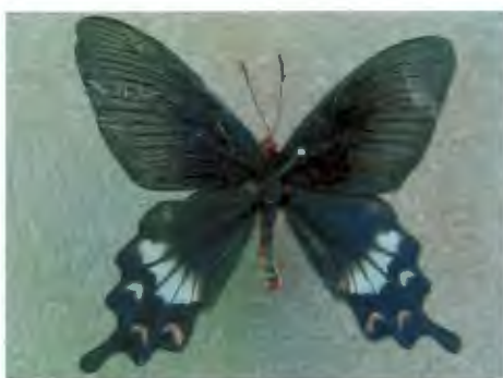
ผีเสื้อกลุ่มหางตั้ง Parides adamsoni (Grose-Smith)