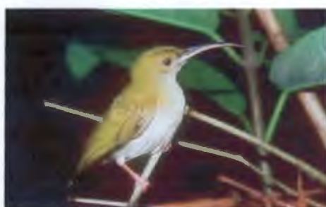
นกปลีกล้วยท้องเทา