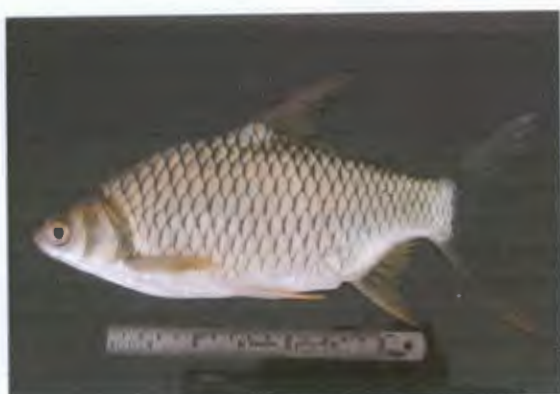
สะเฟียนชาว Barbonymus gonionotus