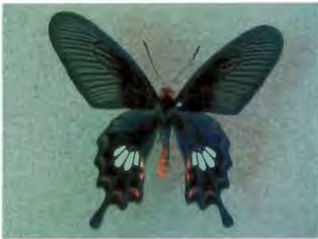
ผีเสื้อหางตุ้มจุดชมพู