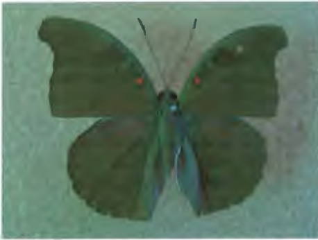
ผีเสื้อตึกจุดแดง