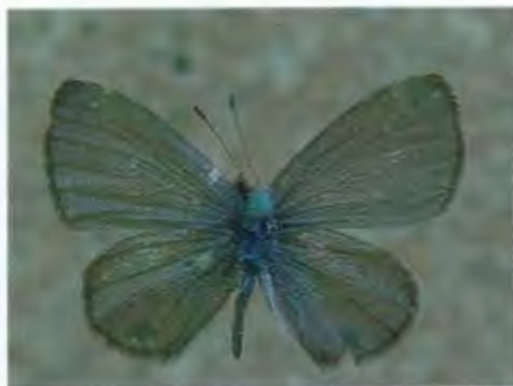
ผีเสื้อกลุ่มฟ้าขีด Prosotas sp.