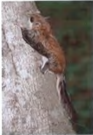
กระรอกบินแก้มสีแดง