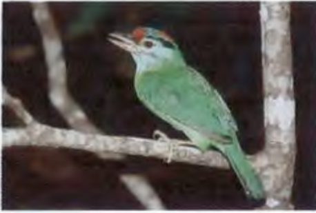
นกโพระดกคอสีฟ้า