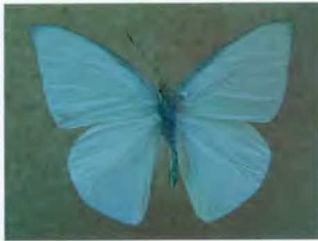
ผีเสื้อหนอนใบกุ่มธรรมดา Appias albina C. and R.Felder