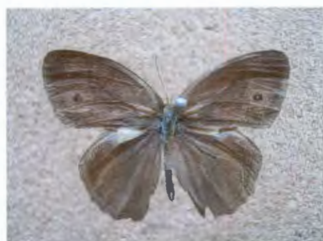
ผีเสื้อกลุ่มตาลพุ่ม Mycalesis perseus Fabricius