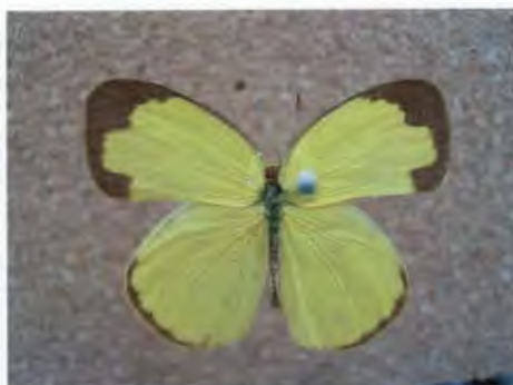
ผีเสื้อเนรแอนเดอร์สัน