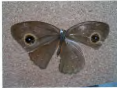
ผีเสื้อตาลพุ่มเหลืองม่วง