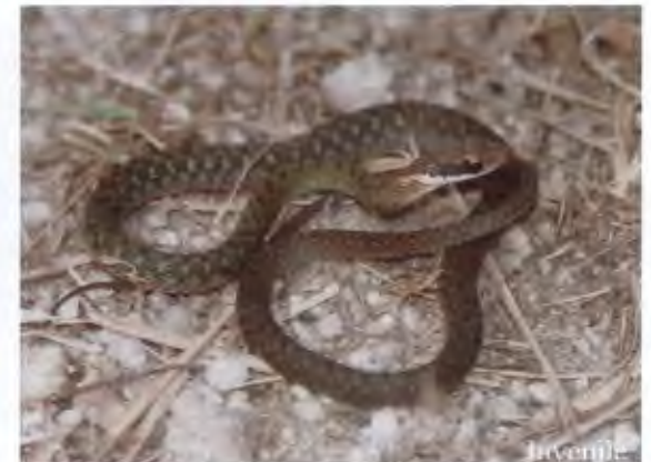
งูลายสบบจุดดำขาว