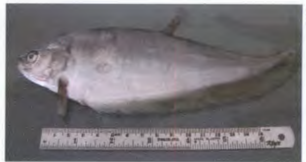
ปลาตะเพียน