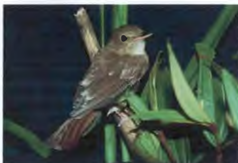
นกจับแมลงอกสีน้ำตาลอ่อน Rhinomyias brunneata (Slater, 1897)