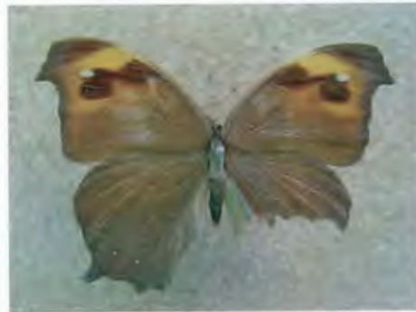
ผีเสื้อสายัณห์สีตาลใหญ่