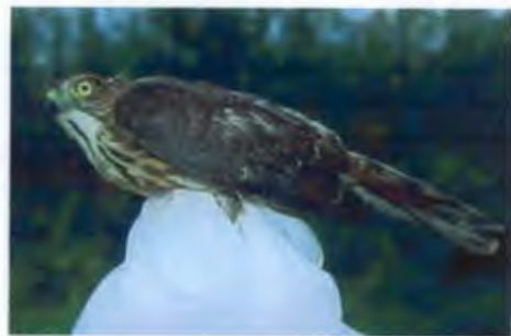
เหยี่ยวนกกระจอกเล็ก