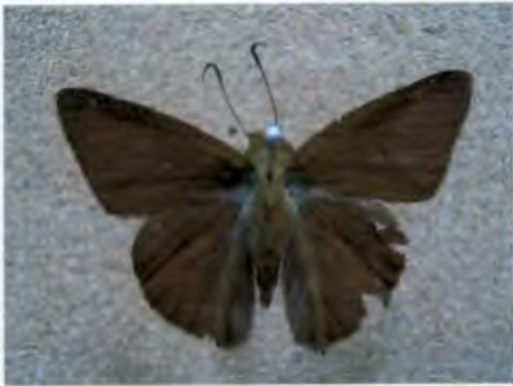
ผีเสื้อกลุ่มหน้าเข็ม Hasora salanga Plötz