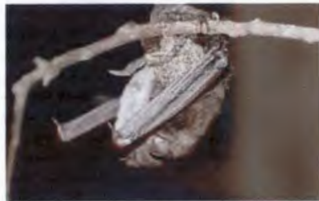
ค้างคาวหูหนוטินเล็กเขี้ยวสั้น