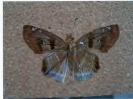
ผีเสื้อตาลแดงโคนขีด Odontoptilum angulata C.Felder