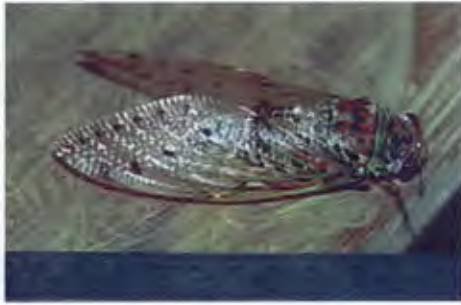
จ๊กจั่น วงศ์ Cicadidae