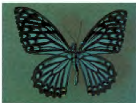
ผีเสื้อเชิงลายธรรมดา Chilasa clytia (Linnaeus)