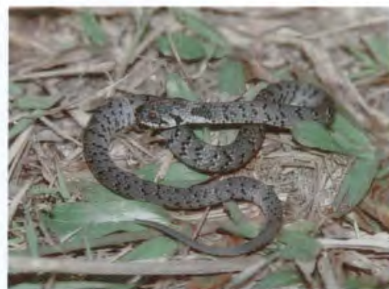
งูกินதாகจูดขาว