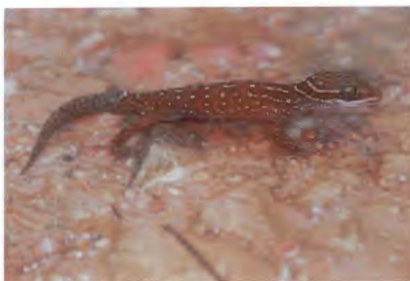
ตุ๊กแกปากคอรวัน