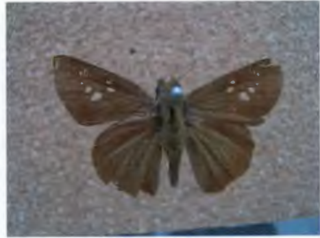
ผีเสื้อกลุ่มบินเร็ว