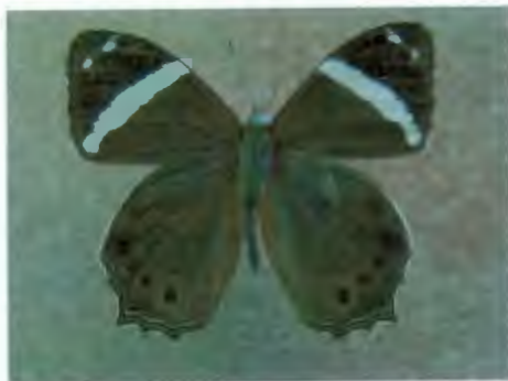
ผีเสื้อเสอะทะเลลายแถบ