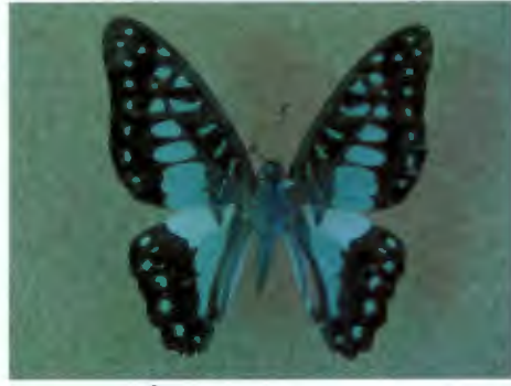
ผีเสื้อหนอนจำปีจุดแฉก