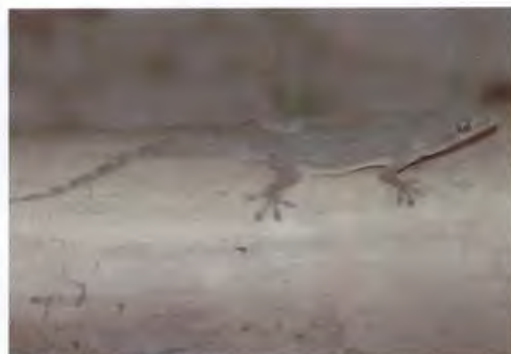
จิ้งจกหางเรียบ

Hemidactylus frenatus Dumeril and Bibron, 1836