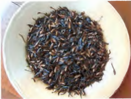
ปลวก อันดับ Isoptera