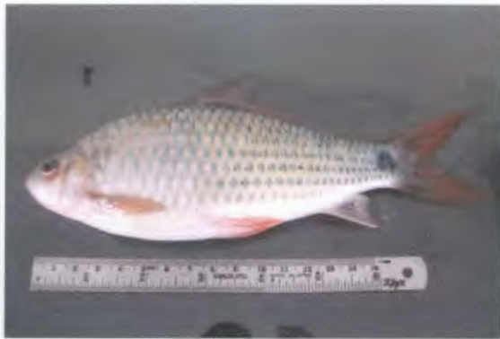
สร้อยนกเขา