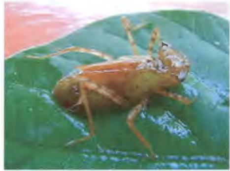
ตัวอ่อนแมลงปอ วงศ์ Libellulidae