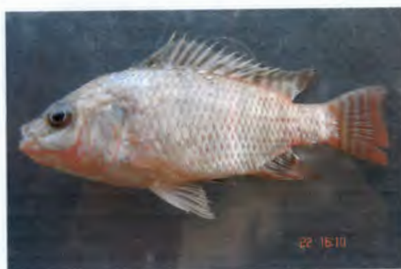
นึล Tilapia nilotica