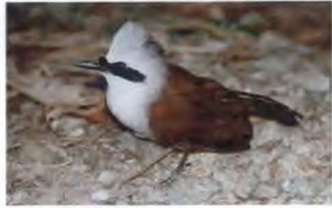
นกกระรางหัวหงอก