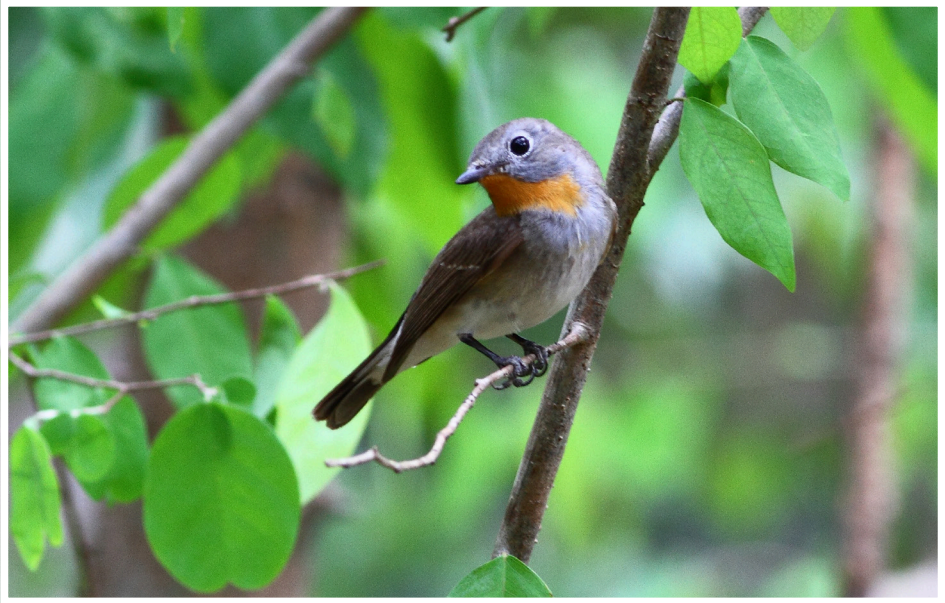
นกจับแมลงคอแดง : Taiga Flycatcher : Ficedula albicilla