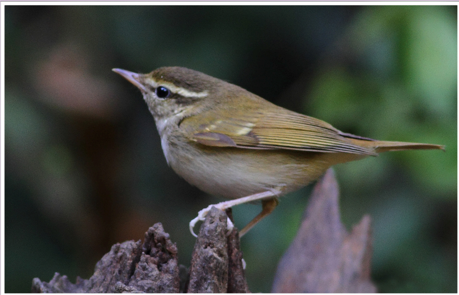
นกกระจัดธรรมดา : Yellow-browed Leaf Warbler : Phylloscopus inornatus