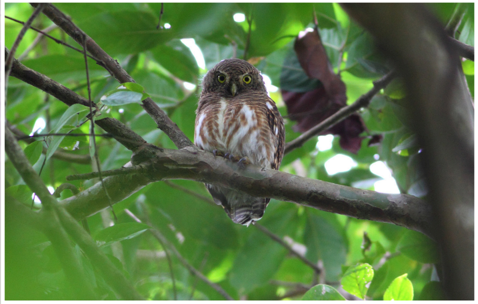
นกเค้าโมง : Asian Barred Owlet : Glaucidium cuculoides