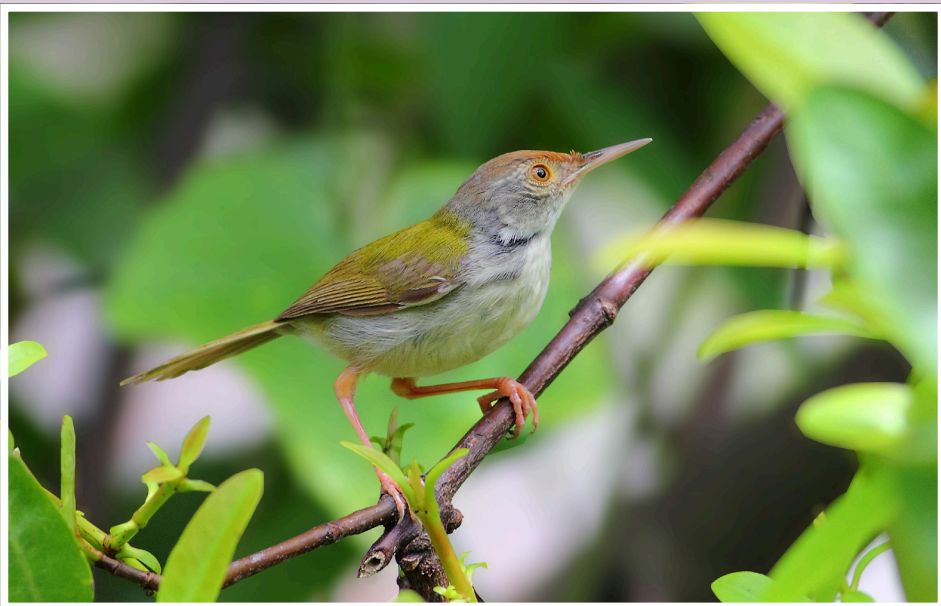
นกกระจิบธรรมดา : Common Tailorbird : Orthotomus sutorius