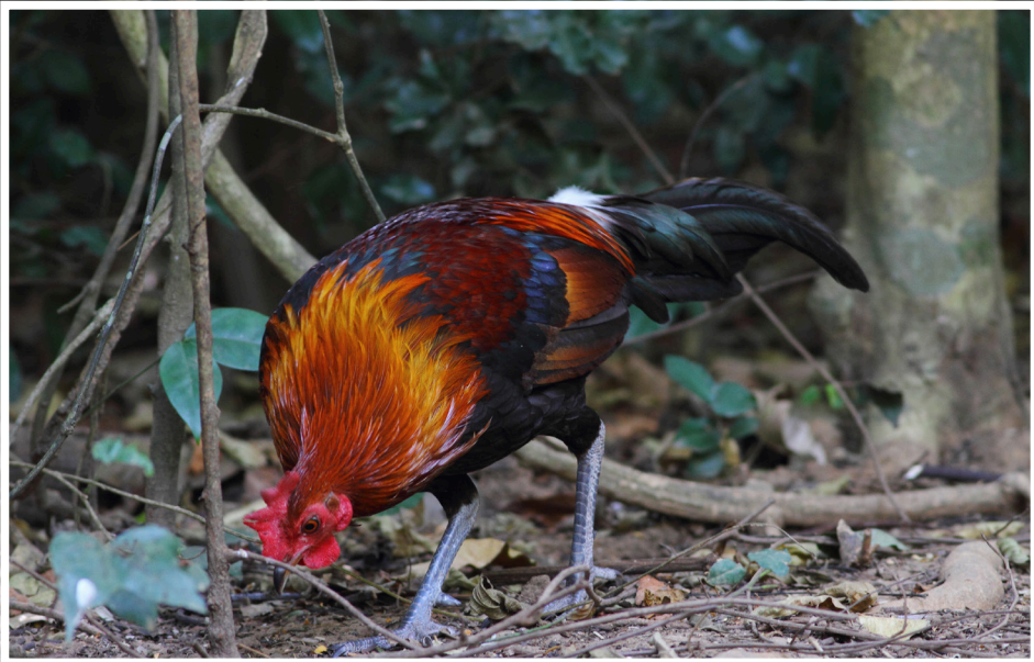
ไก่ป่า : Red Junglefowl : Gallus gallus