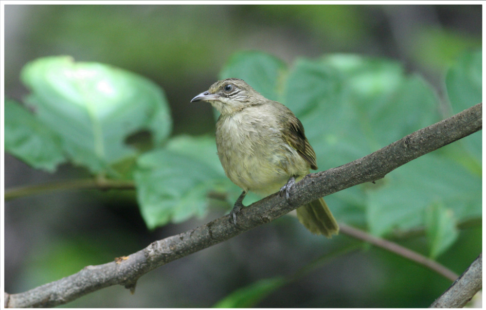
นกปรอดสวน : Streak-eared Bulbul : Pycnonotus blanfordi