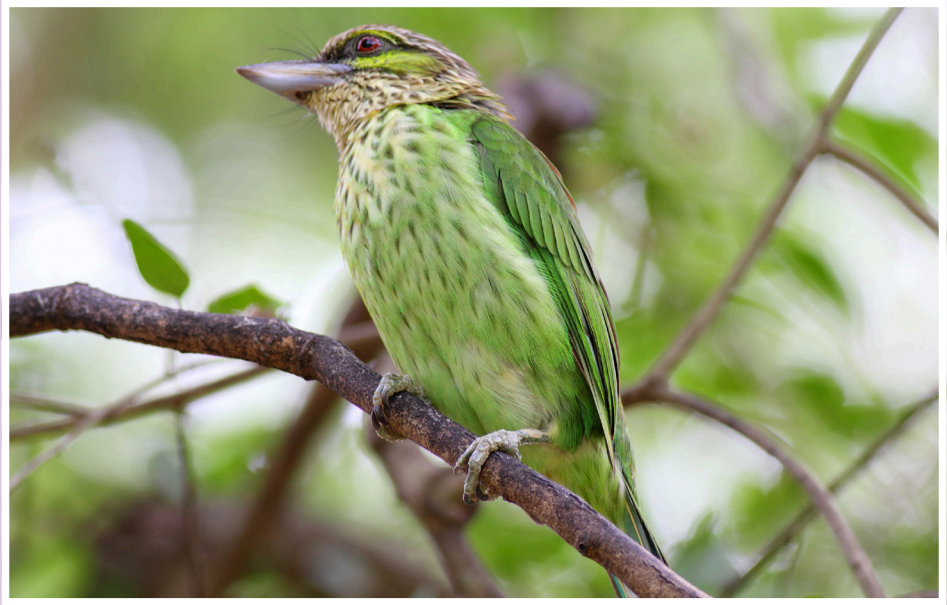
นกโพระดกหูเขียว : Green-eared Barbet : Megalaima faiostriata