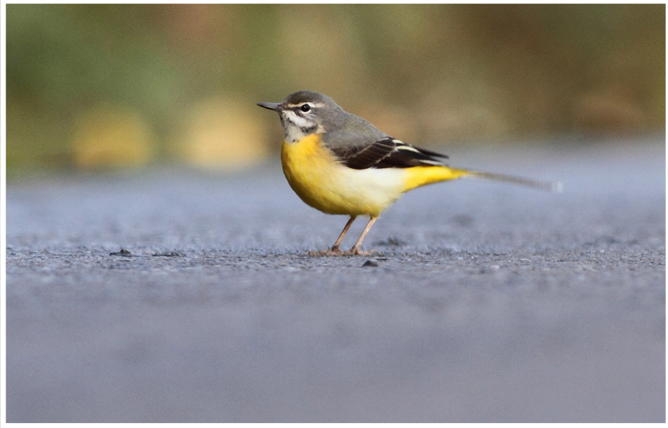
นกเด้าลมหลังเทา : Grey Wagtail : Motacilla cinerea