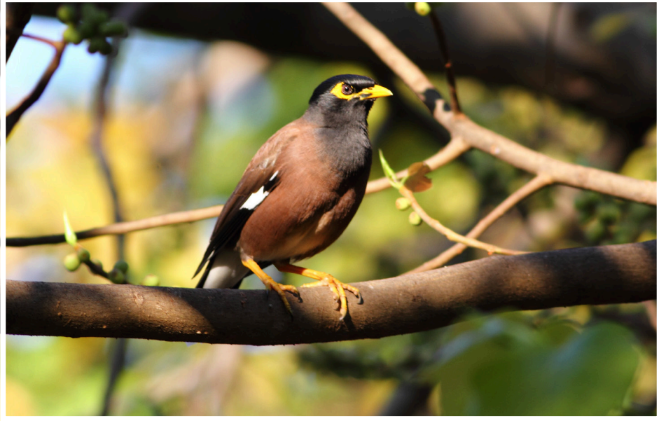
นกเอี้ยงสาริกา : Common Myna : Acridotheres tristis