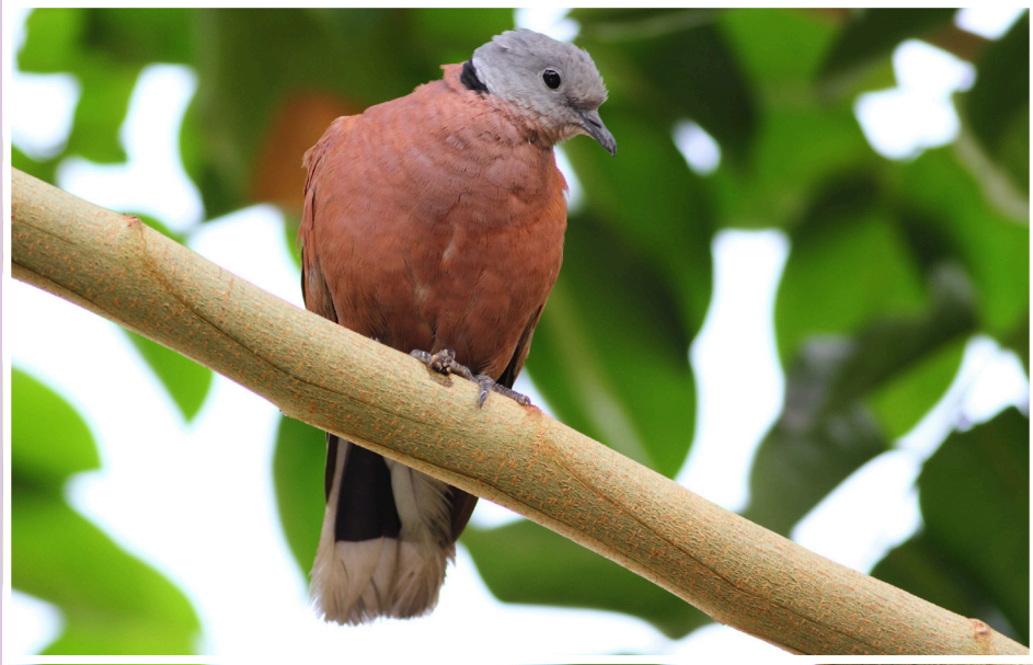
นกเขาไฟ : Red Collared Dove : Streptopelia tranquebarica