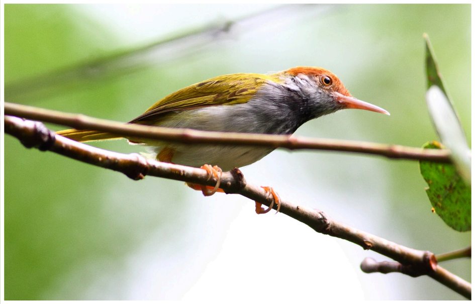
นกกระจิบคอดำ : Dark-necked Tailorbird : Orthotomus atrogularis