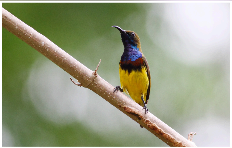
นกกินปลีอกเหลือง : Olive-backed Sunbird : Cinnyris jugularis