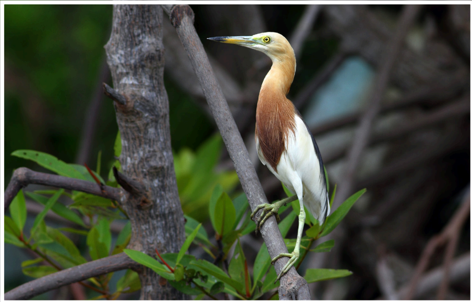
นกยางกรอกพินธุ์ชวา : Javan Pond Heron : Ardeola speciosa