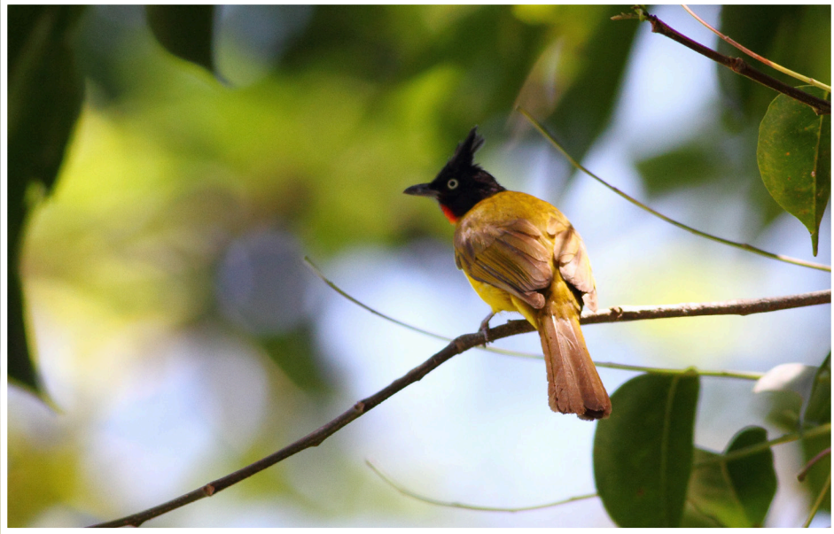
นกปรอดเหลืองหัวจุก : Black-crested Bulbul : Pycnonotus flaviventris