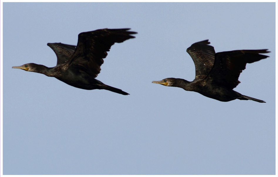
นกกาน้ำปากยาว : Indian Cormorant : Phalacrocorax fuscicollis