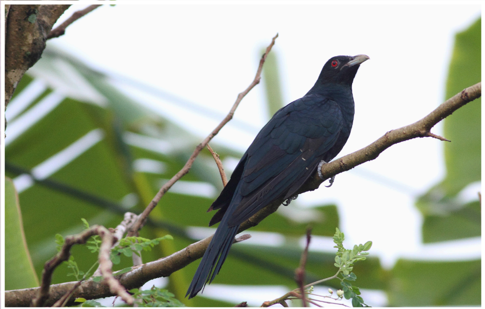
นกกาเหว่า : Asian Koel : Eudynamys scolopaceus