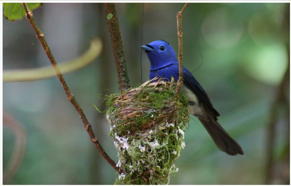
นกจับแมลงจุกดำ : Black-naped Monarch : Hypothymis azurea