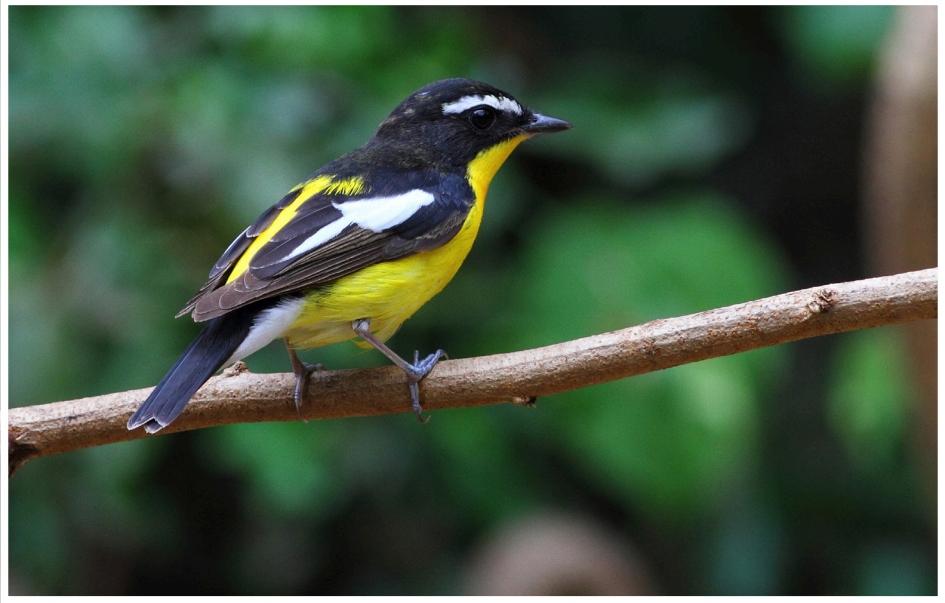
นกจับแมลงตะโพกเหลือง : Yellow-rumped Flycatcher : Ficedula zanthopygia