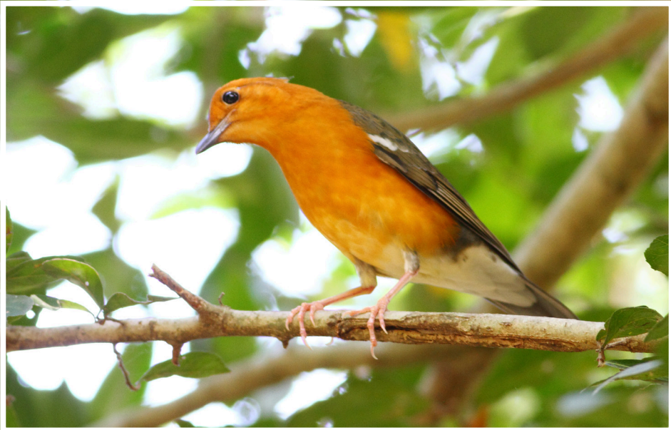
นกเตนดงหัวสีส้ม : Orange-headed Thrush : Geokichla citrina