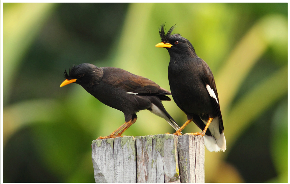
นกเอี้ยงหงอน : White-vented Myna : Acridotheres grandis