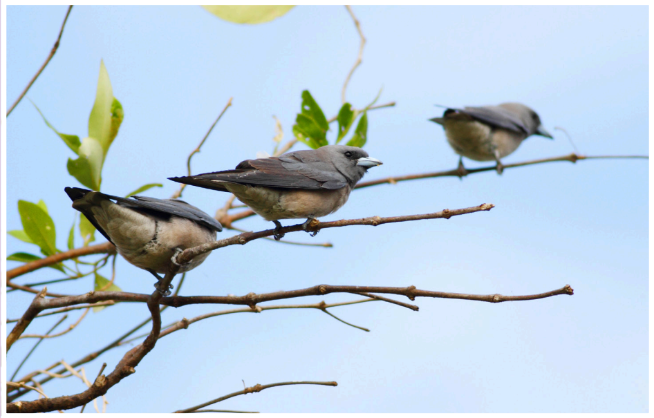
นกแอ่นพง : Ashy Woodswallow : Artamus fuscus