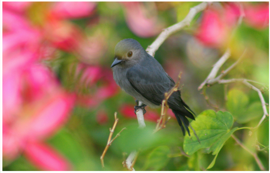
นกแซงแซวสีเทา : Ashy Drongo : Dicrurus leucophaeus