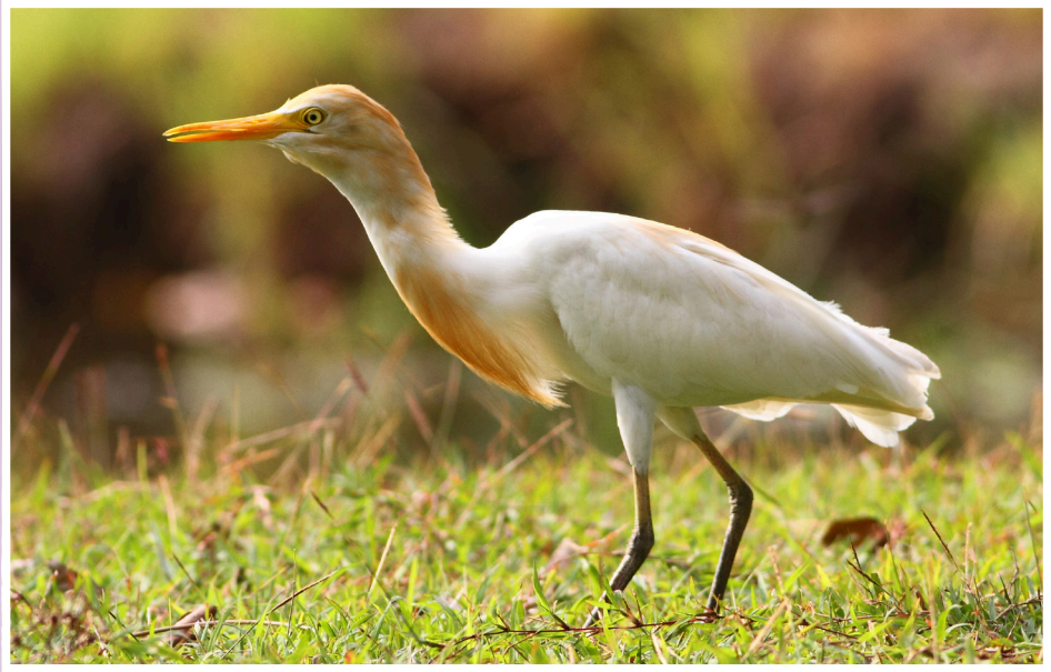
นกยางควาย : Eastern Cattle Egret : Bubulcus coromandus