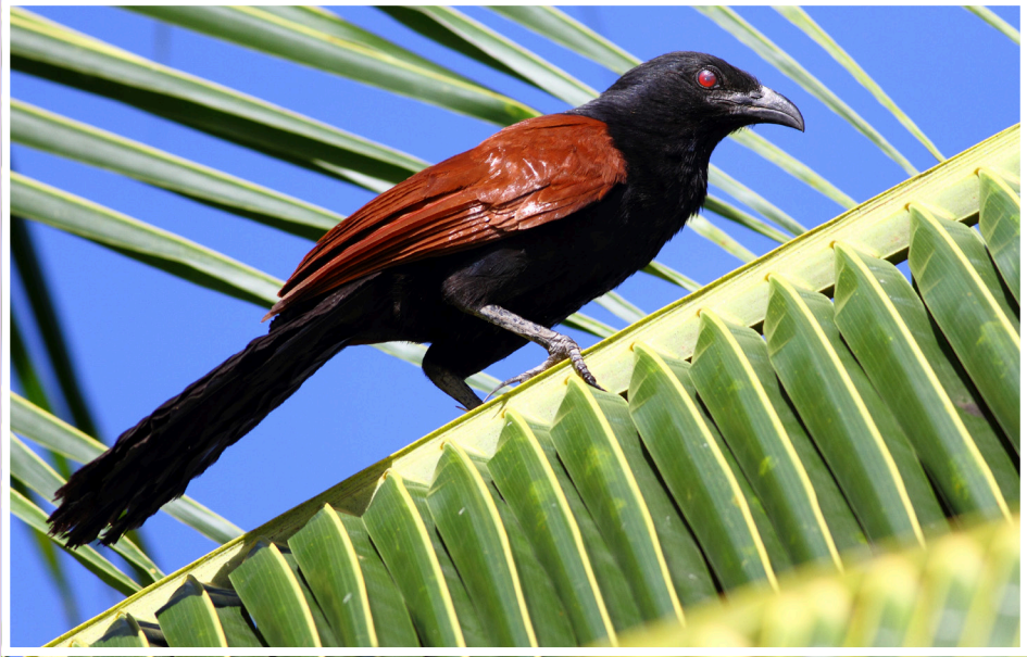
นกกระปูดใหญ่ : Greater Coucal : Centropus sinensis