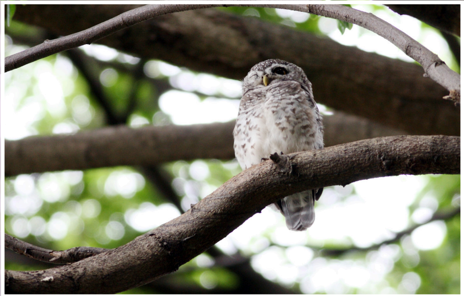
นกเค้าจุด : Spotted Owlet : Athene brama