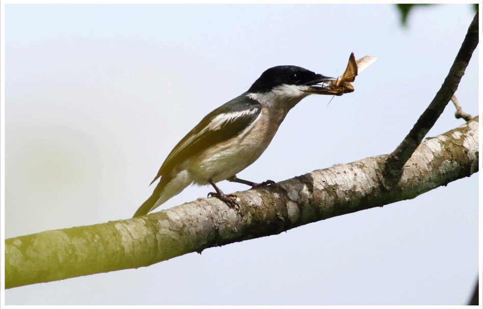
นกเขนน้อยปีกแถบขาว : Bar-winged Flycatcher-shrike : Hemipus picatus