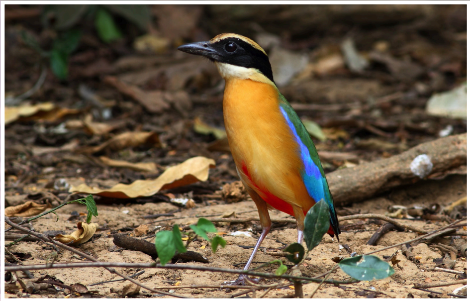
นกแต้วแล้วธรรมดา : Blue-wingd Pitta : Pitta moluccensis