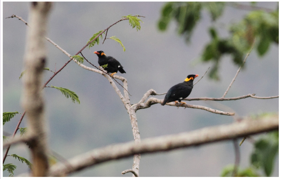
นกขุนทอง : Common Hill Myna : Gracula religiosa