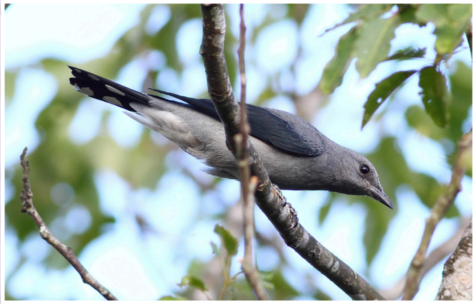
นกเงี้ยวขี้ผึ้งใหญ่ : Black-winged Cuckooshrike : Coracina melaschistos