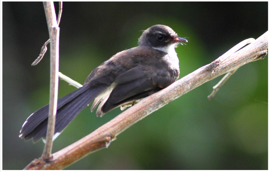
นกอีแพรดแถบอกดำ : Pied Fantail : Rhipidura javanica