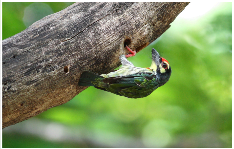
นกตีทอง : Coppersmith Barbet : Megalaima haemecephala