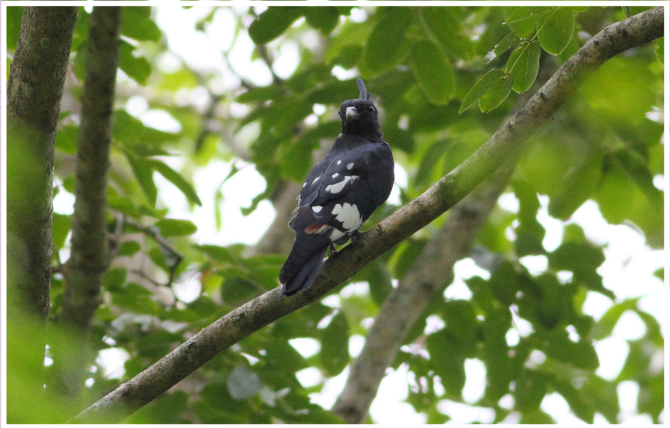
เหยี่ยวกิ่งก่าสีดำ : Black Baza : Aviceda jerdoni