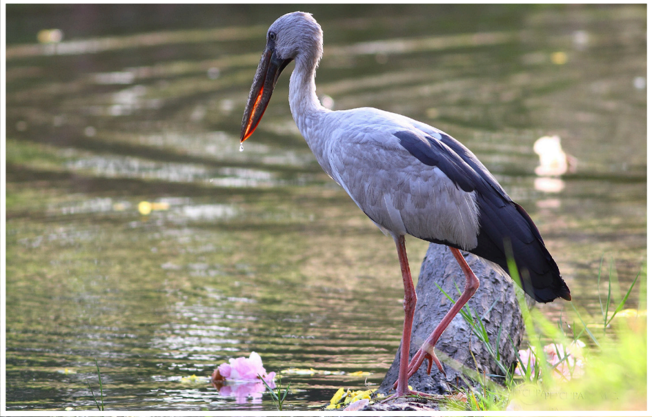
นกปากห่าง : Asian Openbill : Anastomus oscitans