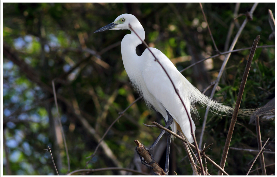
นกยางโทนน้อย : Intermediate Egret : Egretta intermedia