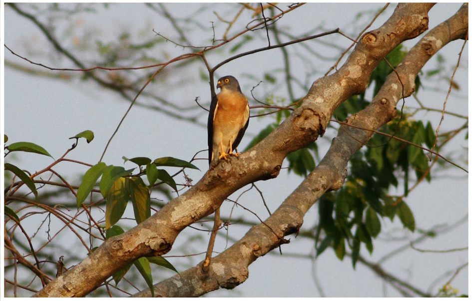
เหยี่ยวนกเขาพันธุ์จีน : Chinese Sparrowhawk : Accipiter soloensis