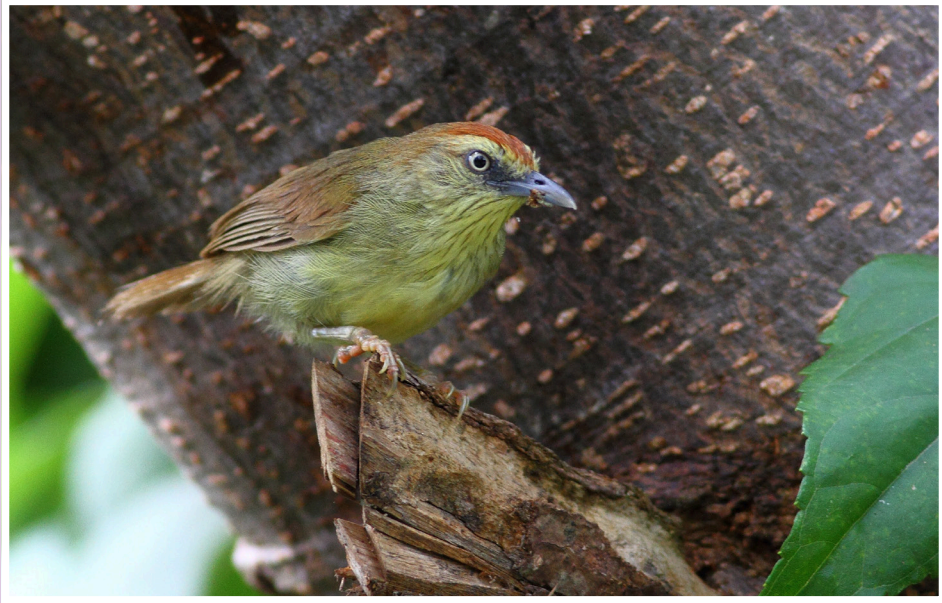
นกกินแมลงอกเหลือง : Pin-striped Tit Babbler : Macronus gularis