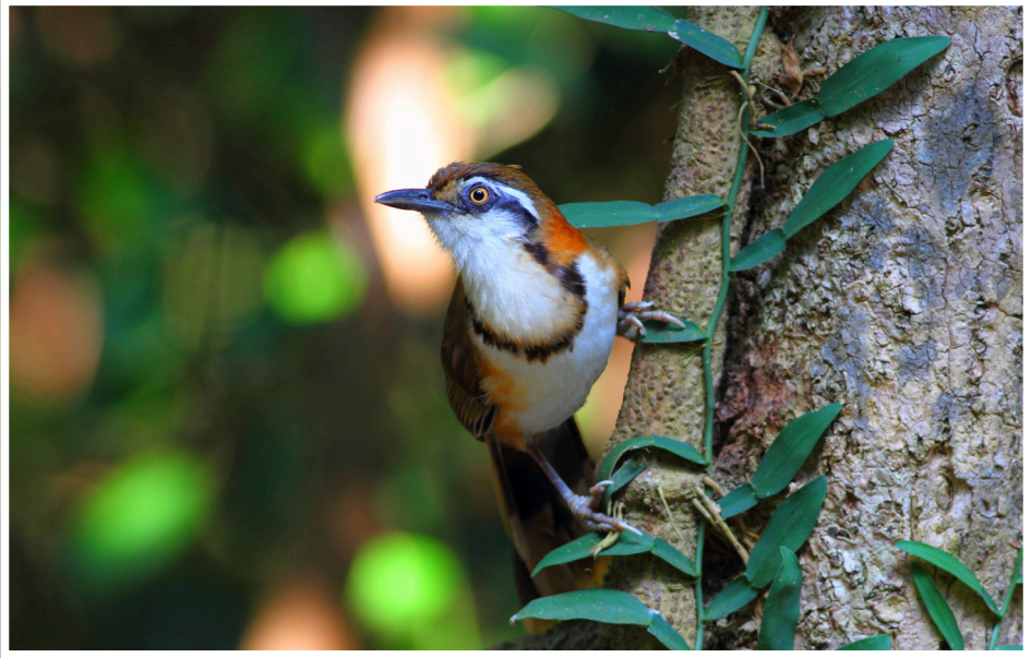
นกกระรางสร้อยคอเล็ก : Lesser Necklaced Laughingthrush : Garrulax monileger