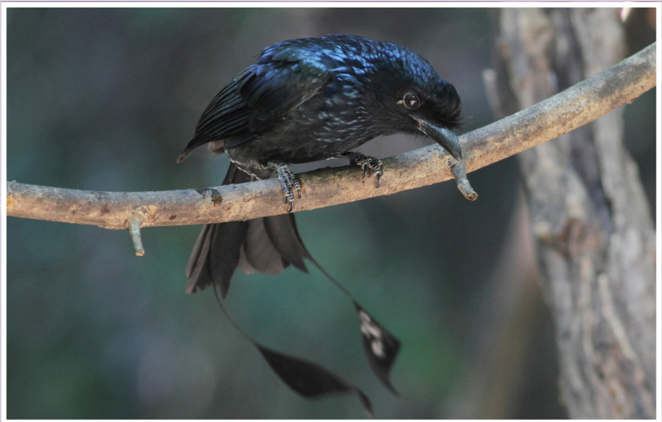
นกแซงแซวหางบ่วงใหญ่ : Greater Racket-tailed Drongo : Dicrurus paradiseus