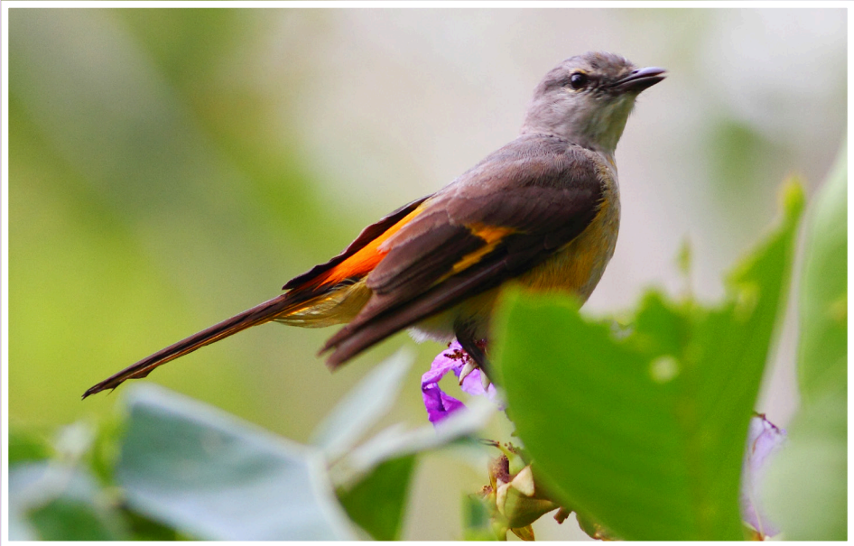
นกพญาไฟเล็ก : Small Minivet : Pericrocotus cinnamomeus