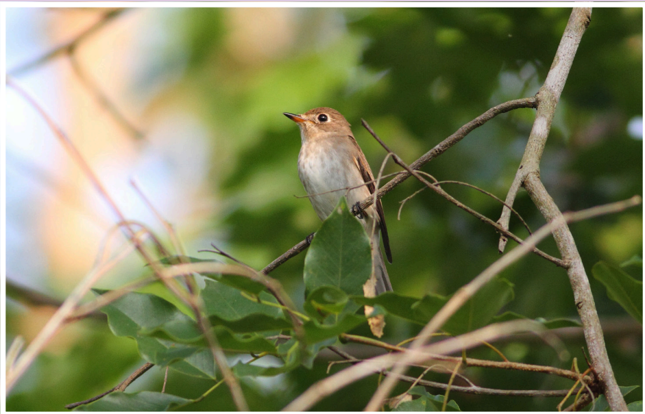
นกจับแมลงสีน้ำตาล : Asian Brown Flycatcher : Muscicapa dauurica