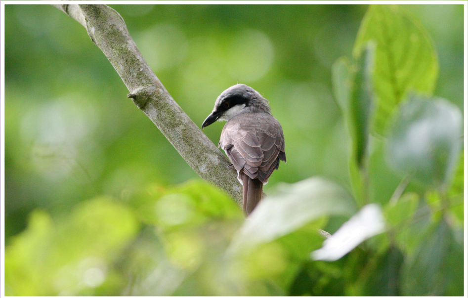
นกเงี้ยวตงธรรมดา : Common Woodshrike : Tephrodornis pondicerianus