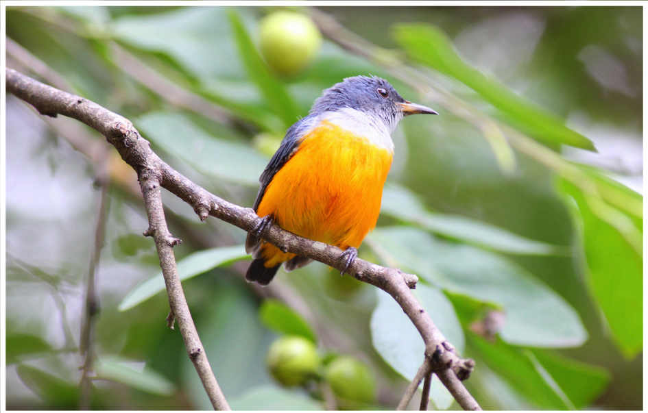
นกกาฝากท้องสีส้ม : Orange-bellied Flowerpecker : Dicaeum trigonostigma