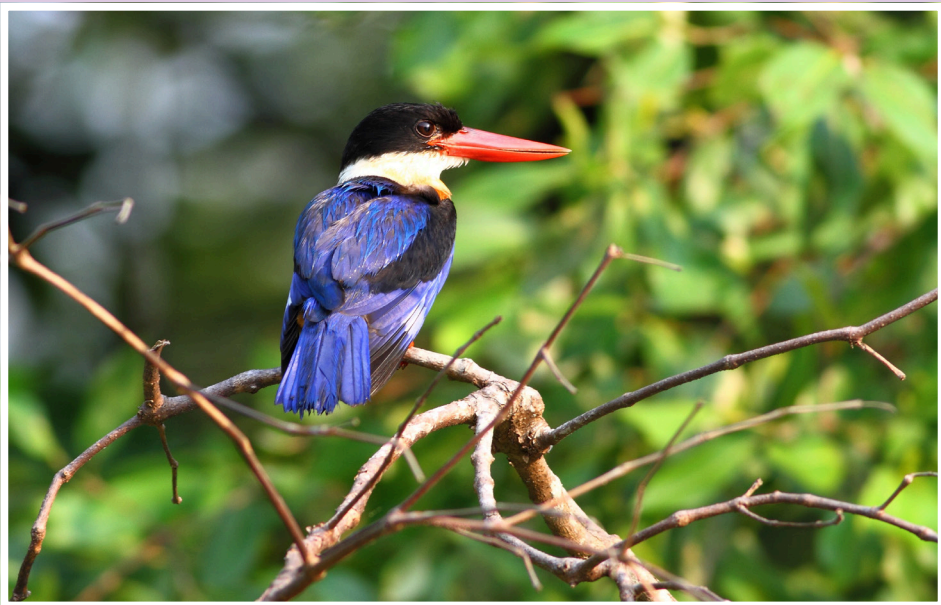
นกกระเต็นหัวดำ : Black-capped Kingfisher : Halcyon pileata