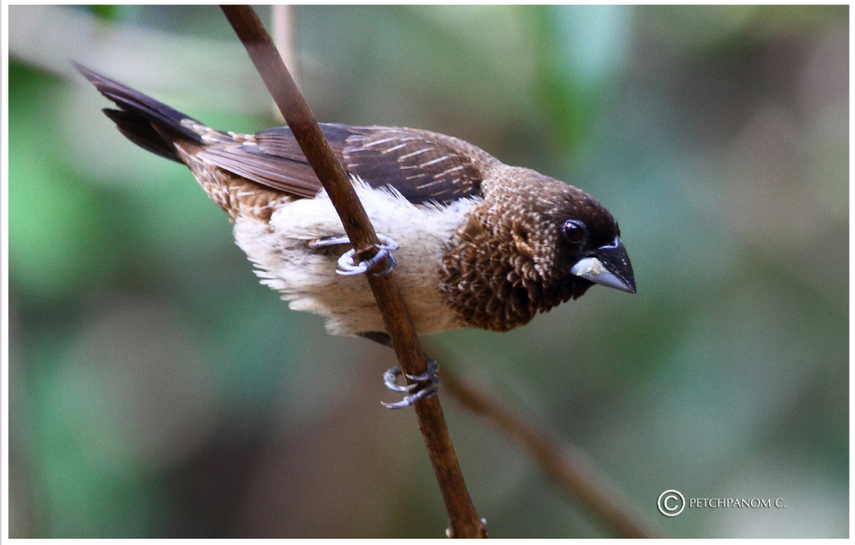
นกกระตีดตะโพกขาว : White-rumped Munia : Lonchura striata