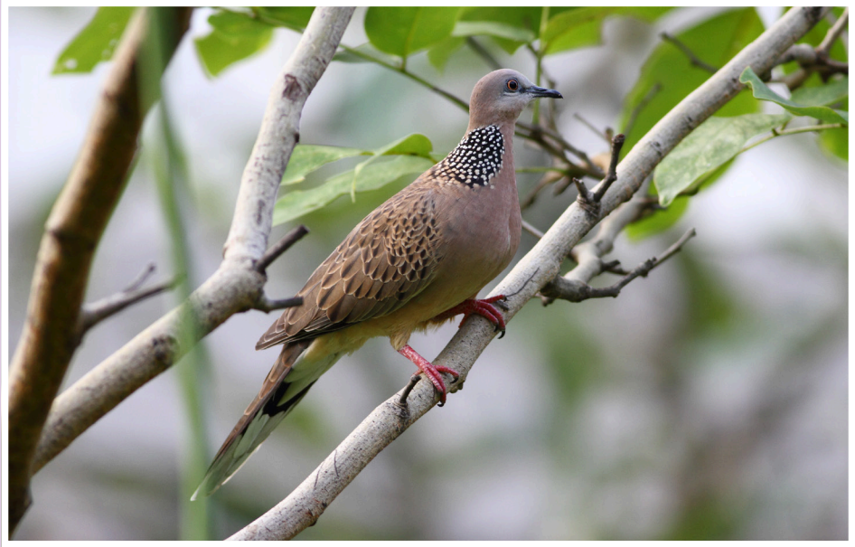
นกเขาใหญ่ : Spotted Dove : Spilopelia chinensis