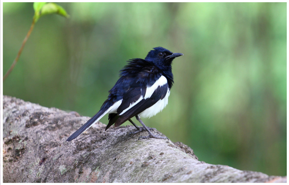
นกกาขงขนบ้าน : Oriental Magpie Robin : Copsychus saularis