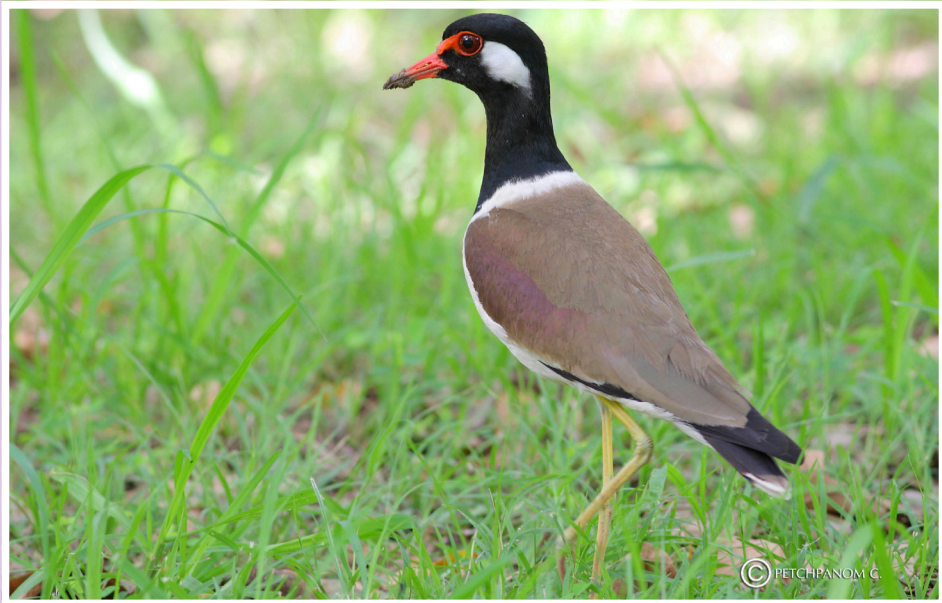
นกกระเตแต้แว๊ด : Red – wattled Lapwing : Vanellus indicus