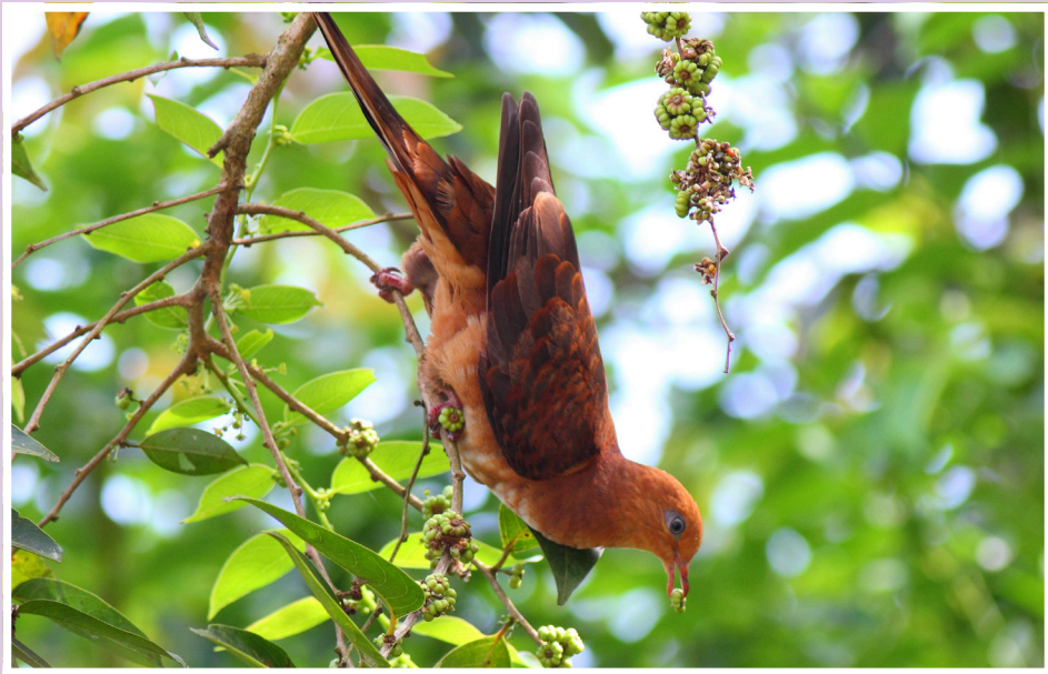
นกเขาลายเล็ก : Little Cuckoo Dove : Macropygia ruficeps