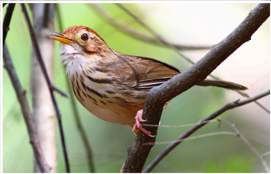
นกจาบดินอกลาย : Puff-throated Babbler : Pellorneum ruficeps