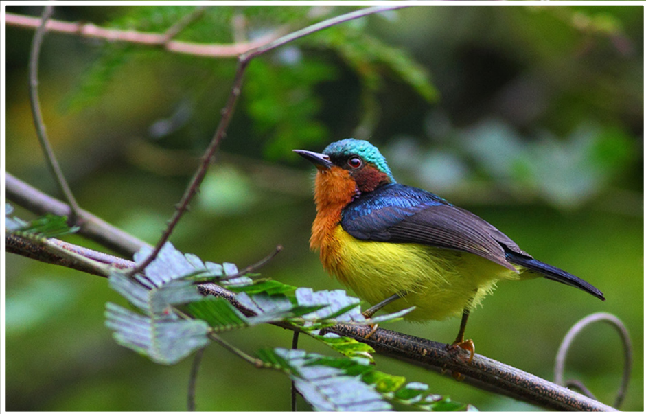
นกกินปลีแก้มสีทับทิม : Ruby-cheeked Sunbird : Chalcoparia singalensis