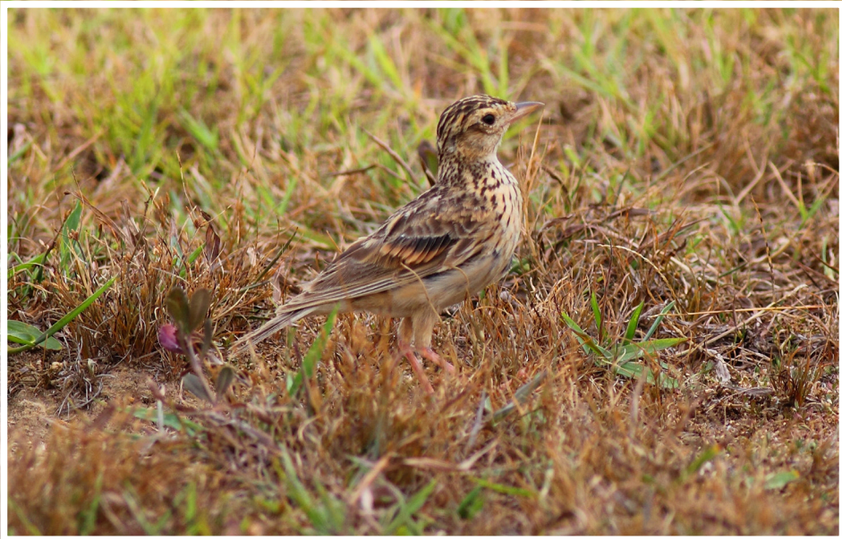
นกเด้าดินทุ่งเล็ก : Paddyfield Pipit : Anthus rufulus