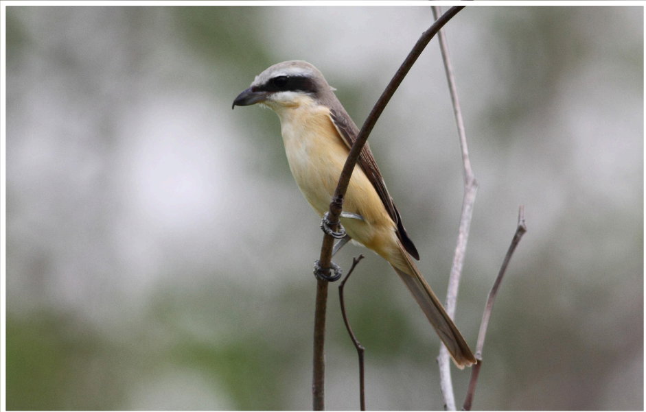
นกอีเสือสีน้ำตาล : Brown Shrike : Lanius cristatus