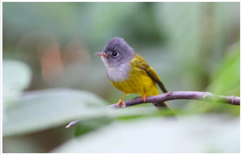
นกจับแมลงหัวเทา : Grey-headed Canary-flycatcher : Culicicapa ceylonensis