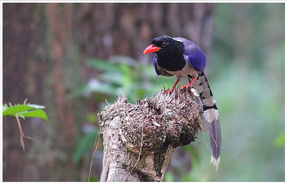
นกขุนแผน : Red-billed Blue Magpie : Urocissa erythroryncha