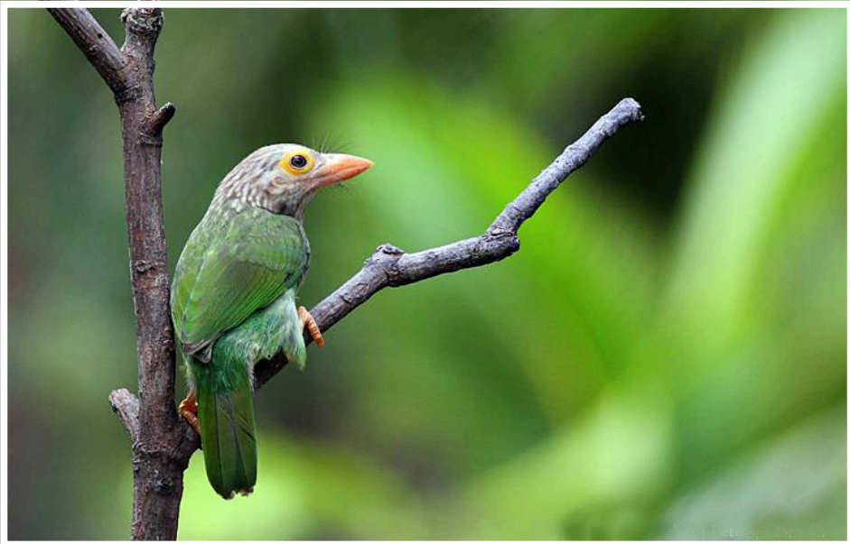
นกโพระดกธรรมดา : Lined Barbet : Megalaima lineata