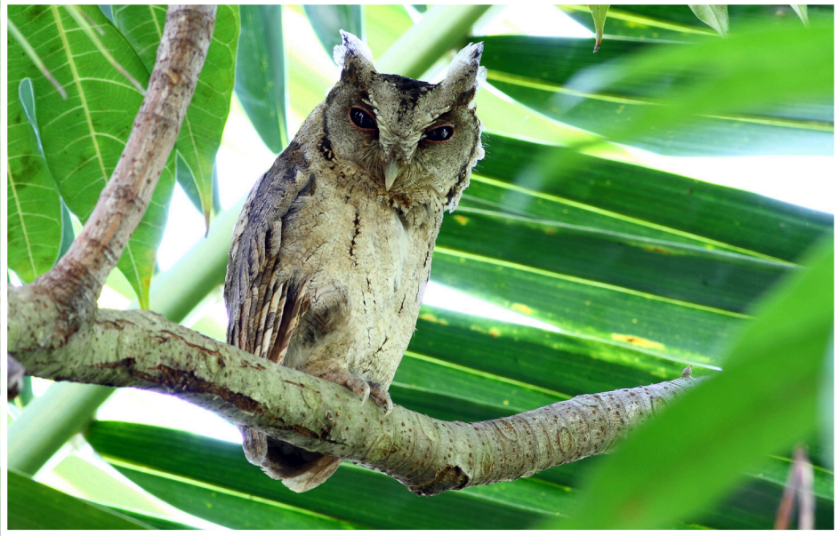
นกเค้ากู่ : Collared Scops Owl : Otus lettia