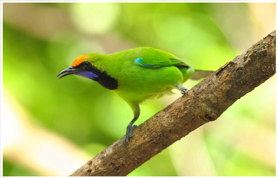
นกเขียวก้านทองหน้าผากสีทอง : Golden-fronted Leafbird : Chloropsis aurifrons