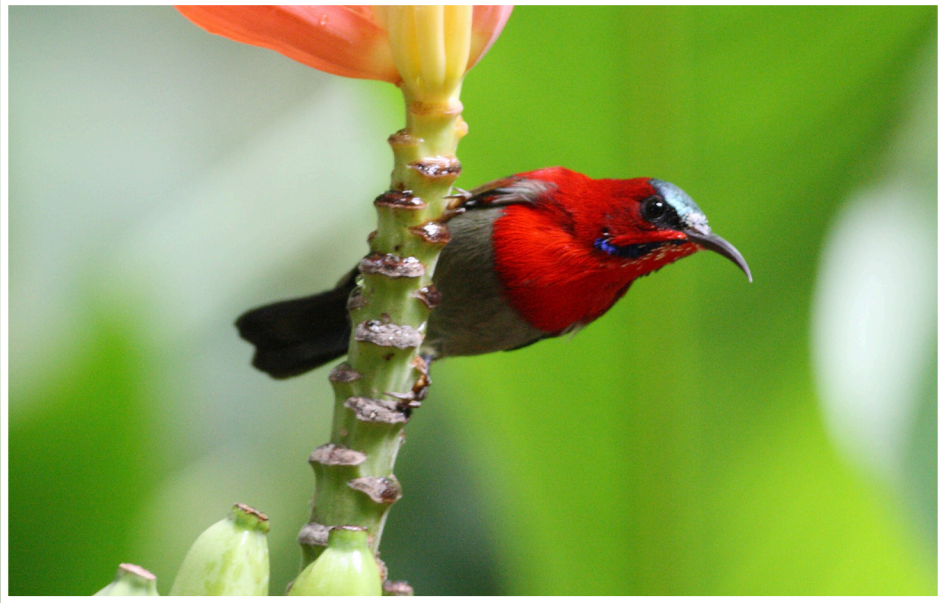
นกกินปลีคอแดง : Crimson Sunbird : Aethopyga siparaja