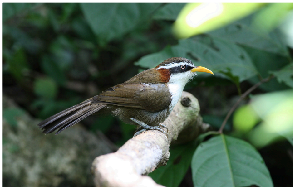
นกกระวังไพรปากเหลือง : White-browed Scimitar Babbler : Pomatorhinus schisticeps