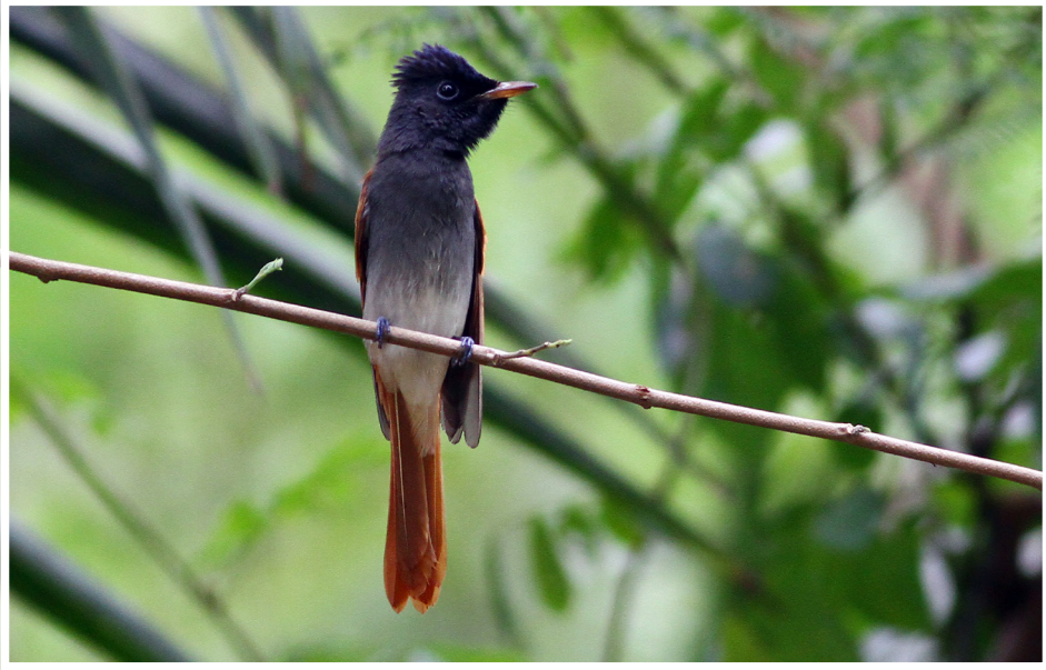
นกแขวสวรรณ : Asian Paradise-flycatcher : Terpsiphone paradisi