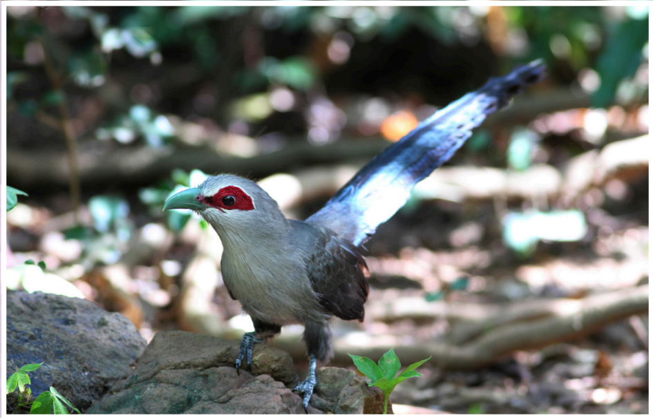
นกบั้งรอกใหญ่ : Green-billed Malkoha : Phaenicophaeus tristis