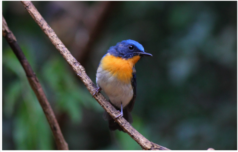
นกจับแมลงอกส้มท้องขาว : Tickell's Blue Flycatcher : Cyornis tickelliae