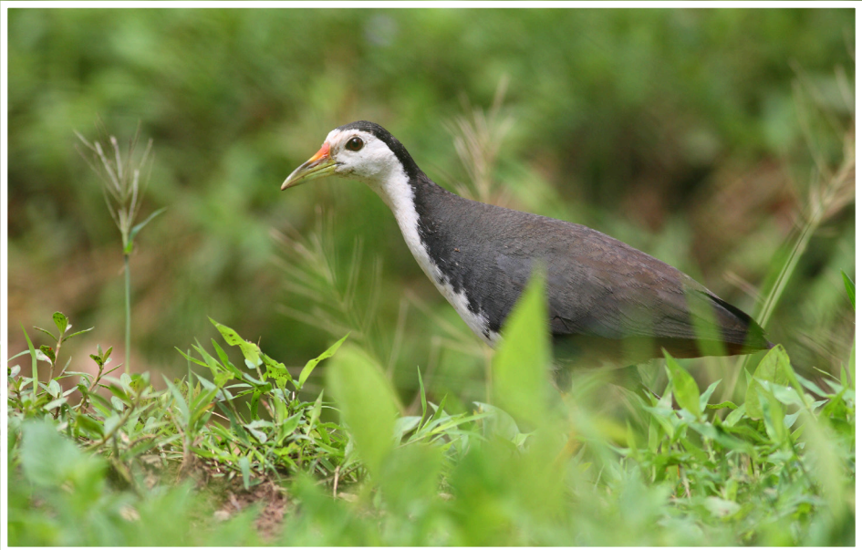
นกก๊วก : White-breasted Waterhen : Amauromis phoenicurus