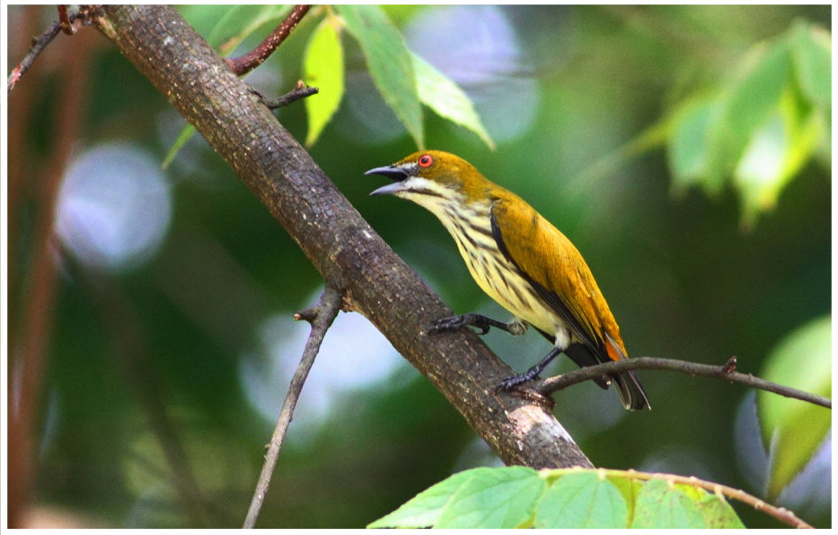
นกกาฝากก้นเหลือง : Yellow-vented Flowerpecker : Dicaeum chrysorrheum