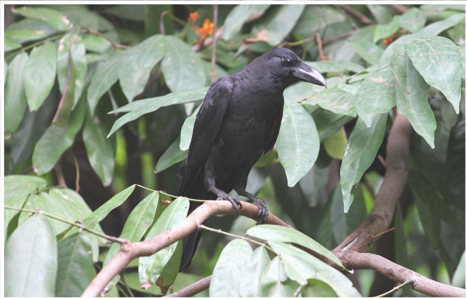
อีกา : Eastern Jungle Crow : Corvus leuillanti