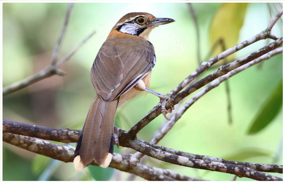
80. นกกระรางสร้อยคอใหญ่ : Greater Necklaced Laughingthrush : Garrulax pectoralis