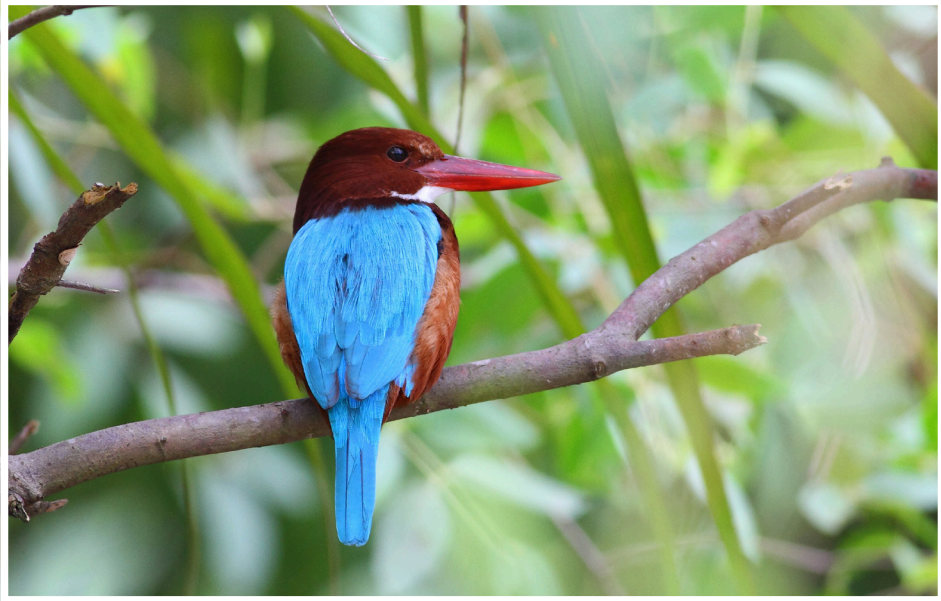
นกกระเต็นอกขาว : White-throated Kingfisher : Halcyon smyensis