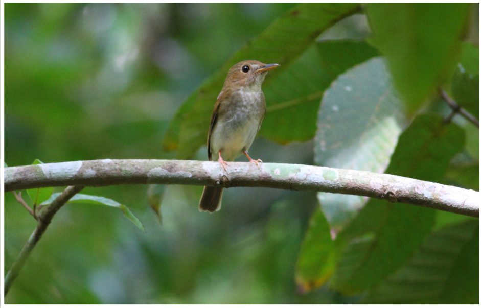
นกจับแมลงอกสีน้ำตาลอ่อน : Brown-chested Jungle Flycatcher : Cyornis brunneatus