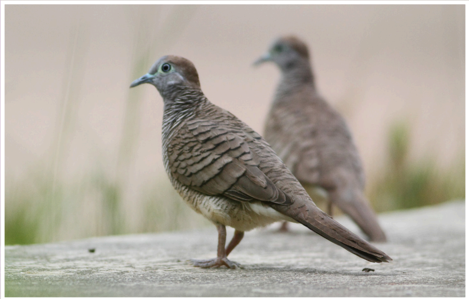
นกเขาชวา : Zebra Dove : Geopelia striata