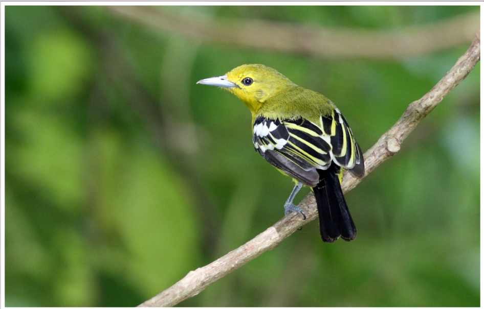
นกขมิ้นน้อยธรรมดา : Common lora : Aegithina tiphia