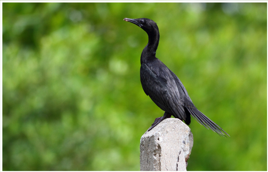
นกกาน้ำเต็ก : Little Cormorant : Microcarbo niger