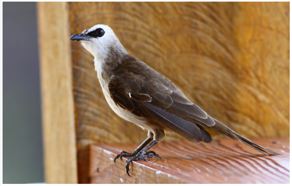
นกปรอดหน้าขาว : Yellow-vented Bulbul : Pycnonotus goiavier