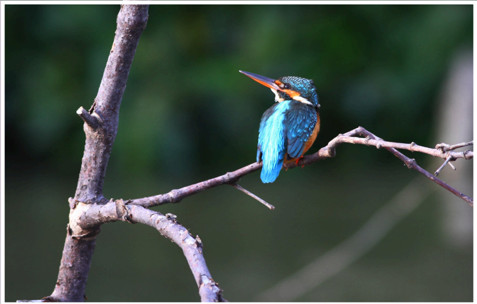
นกกระเต็นน้อยธรรมดา : Common Kingfisher : Alcedo atthis