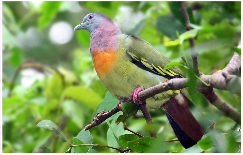
นกเปล้าคอสีม่วง : Pink-necked Green pigeon : Treron vernans