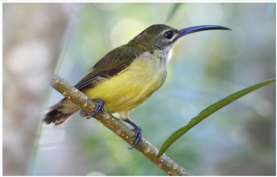
นกปลีกล้วยเล็ก : Little Spiderhunter : Arachnothera longirostra