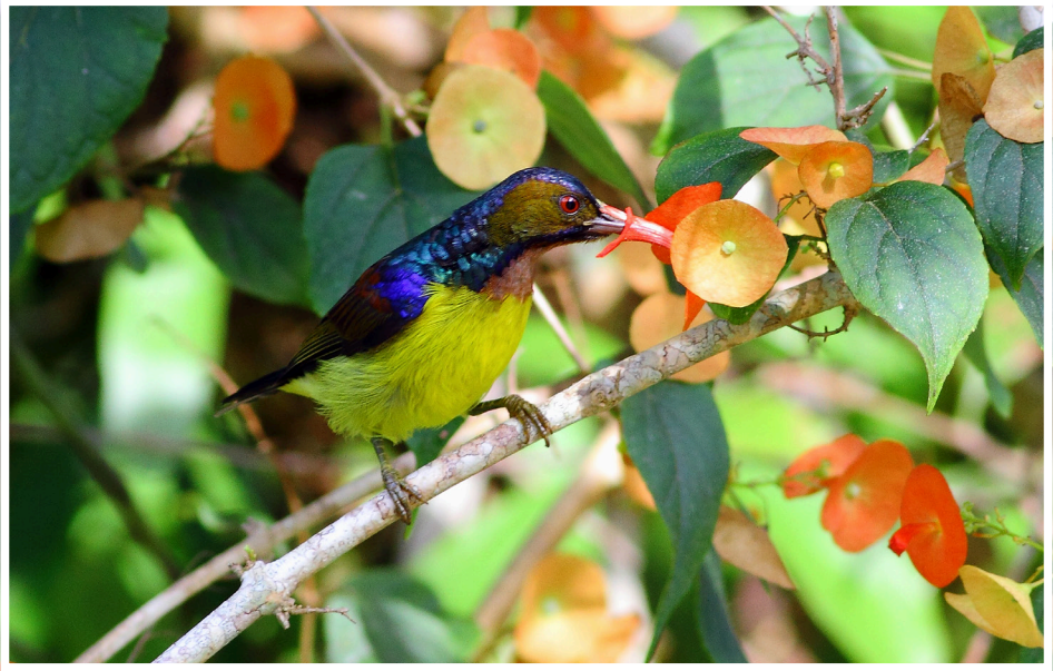
นกกินปลีคอสีน้ำตาล : Brown-throated Sunbird : Anthreptes malacensis