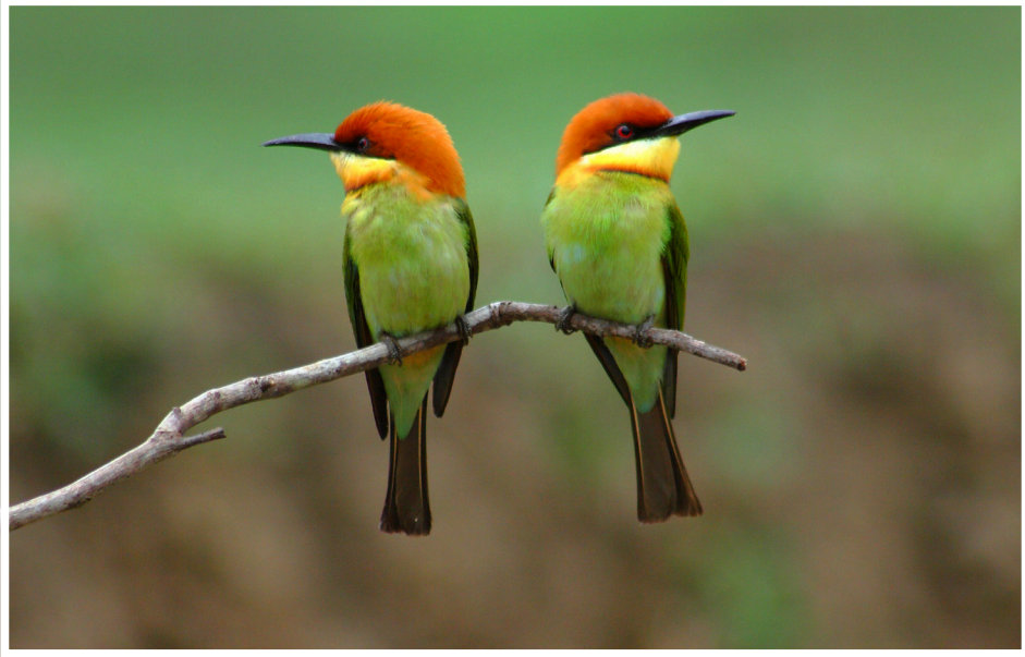
นกจาบคาหัวสีส้ม : Chestnut-headed Bee-eater : Merops leschenaulti