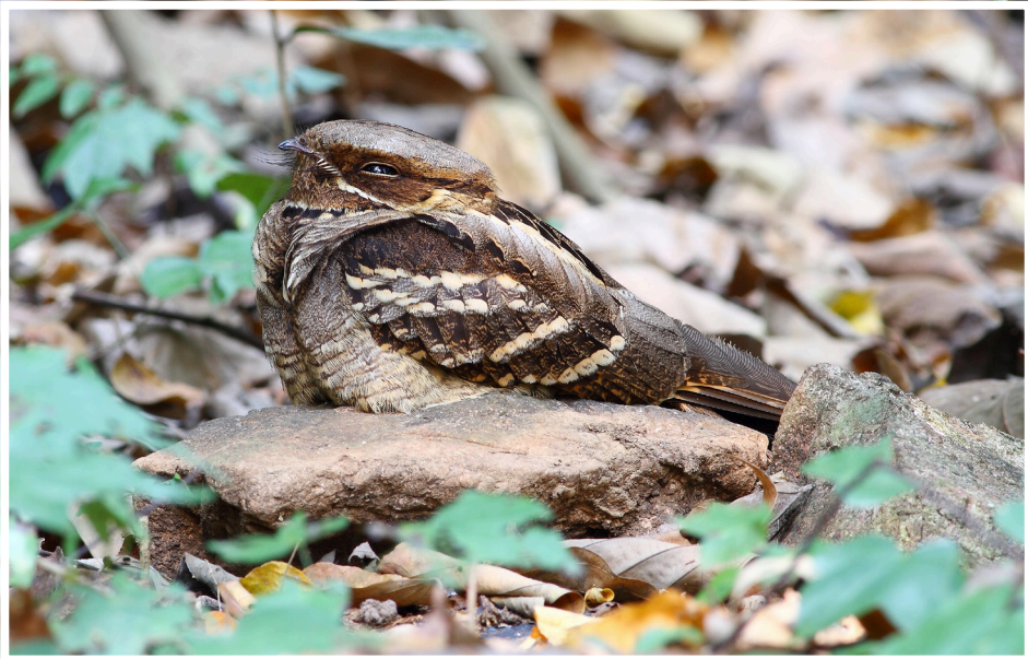
นกตบยุงหางยาว : Large-tailed Nightjar : Caprimulgus macrurus