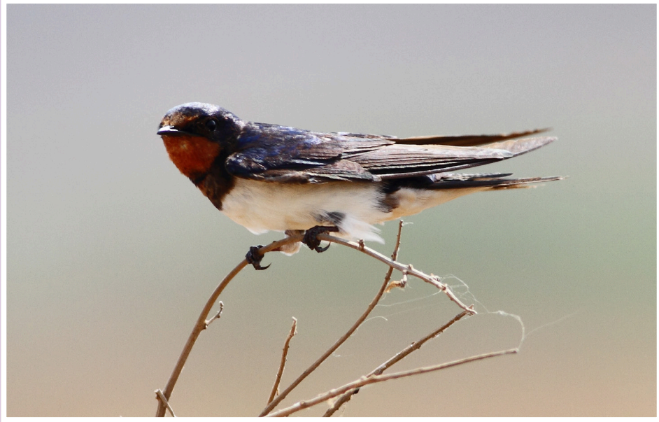
นกนางแอ่นบ้าน : Barn Swallow : Hirundo rustica