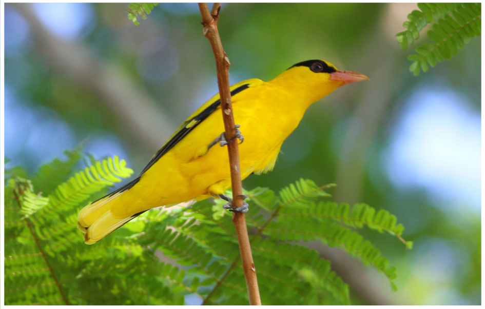
นกขมิ้นท้ายทอยดำ : Black-naped Oriole : Oriolus chinensis