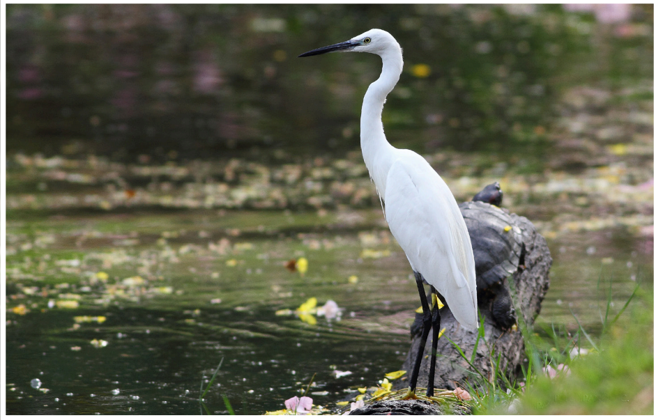
นกยางเป็ย : Little Egret : Egretta garzetta