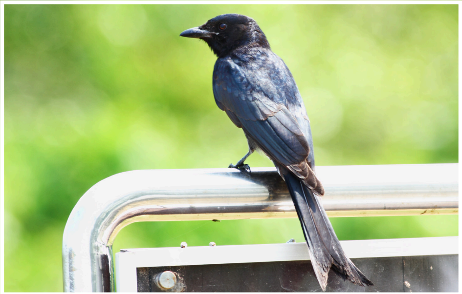
นกแซงแซวหางปลา : Black Drongo : Dicrurus macrocercus