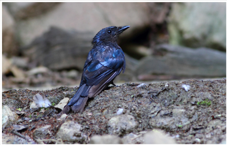
นกแซงแซวเล็กเหลือบ : Bronzed Drongo : Dicrurus aeneus