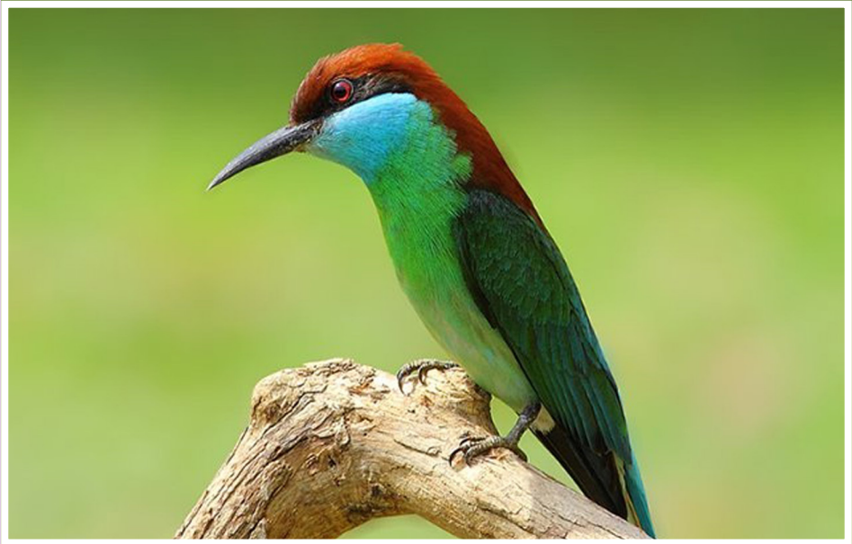
นกจาบคาคอสีฟ้า : Blue-throated Bee-eater : Merops viridis