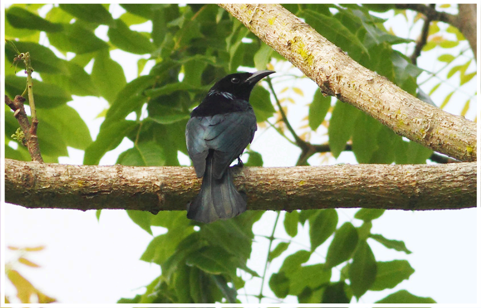
นกแซงแซวหางอนขน : Hair-crested Drongo : Dicrurus hottentottus