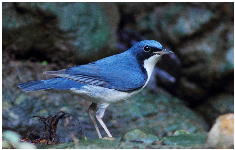
นกเขนน้อยไซบีเรีย : Siberian Blue Robin : Larvivora cyane