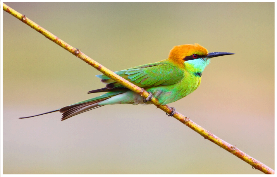
นกจาบคาเล็ก : Green Bee-eater : Meropus orientalis