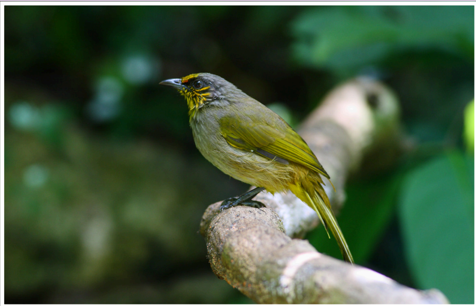
นกปรอดคอลาย : Stripe-throated Bulbul : Pycnonotus finlaysoni