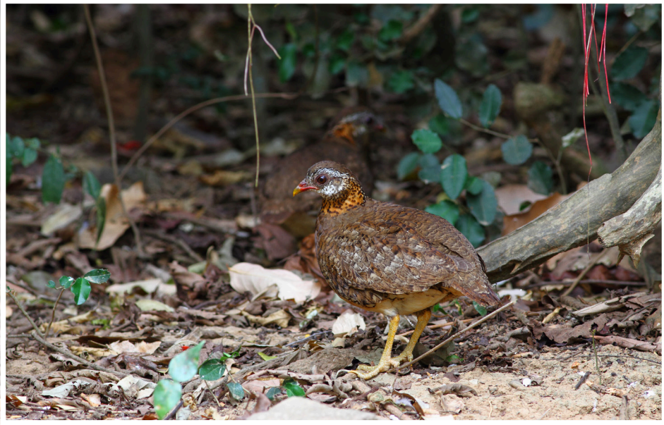
นกกระทาทองแข้งเขียว : Scaly-breasted Partridge : Arborophila chloropus