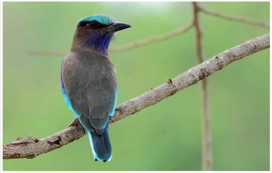
นกตะขาบทุ่ง : Indian Roller : Coracias benghalensis