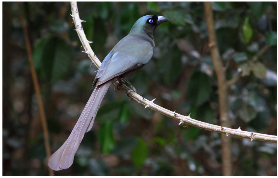
นกกาแวน : Racket-tailed Treepie : Crypsirina temia