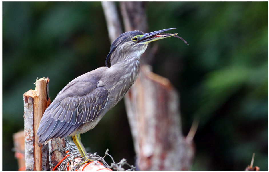
นกยางเขียว : Striated Heron : Butorides striata