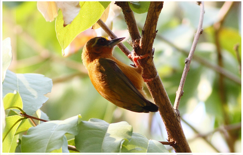
นกหัวขวานจิวคิ้วขาว : White-browed Piculet : Sasia ochracea