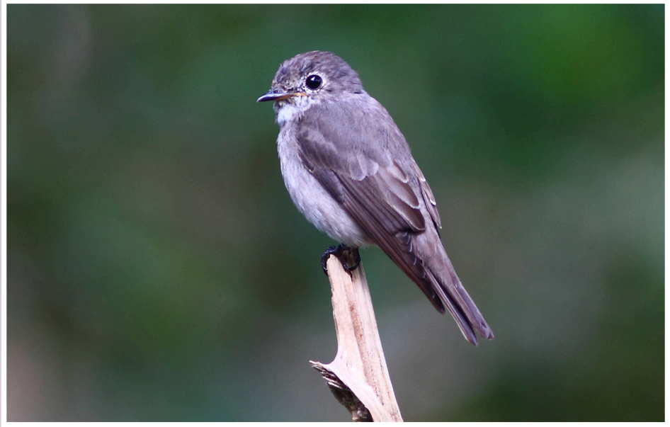
นกจับแมลงสีคล้ำ : Dark-sided Flycatcher : Muscicapa sibirica