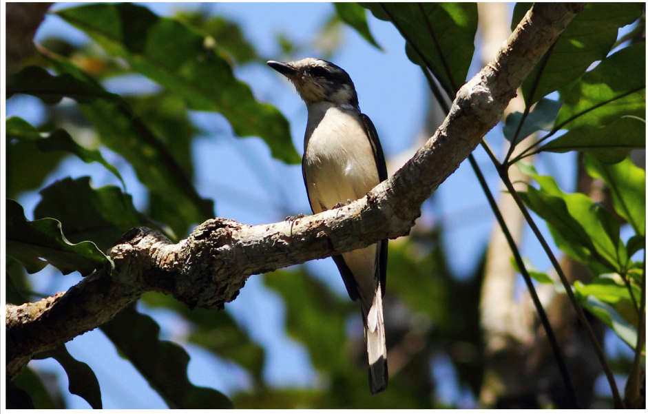
นกพญาไฟสีเทา : Ashy Minivet : Pericrocotus divaricatus