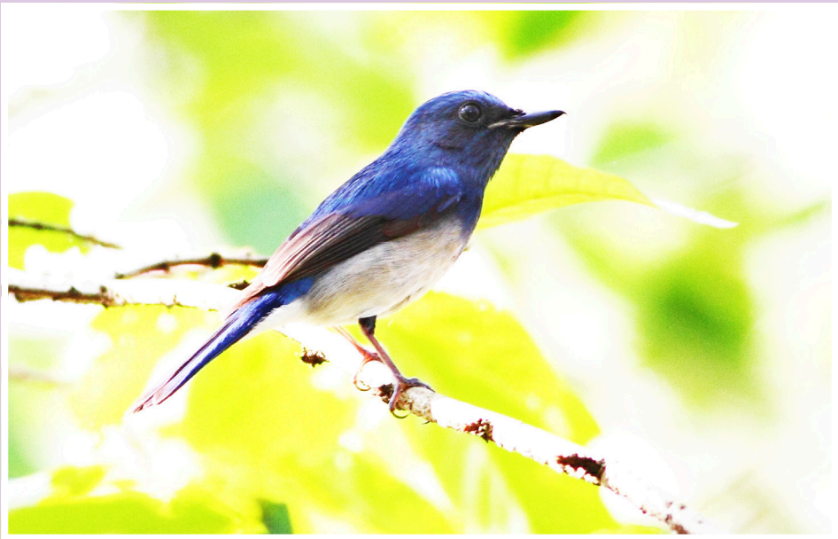
นกจับแมลงอกสีฟ้า : Hainan Blue Flycatcher : Cyornis hainanus