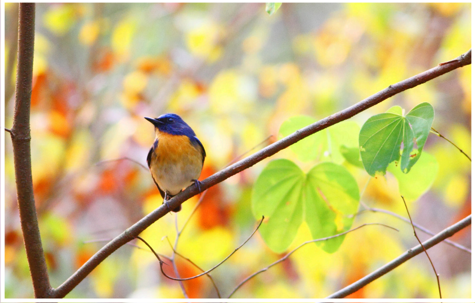
นกจับแมลงคอน้ำตาลแดง : Hill Blue Flycatcher : Cyornis banyumas