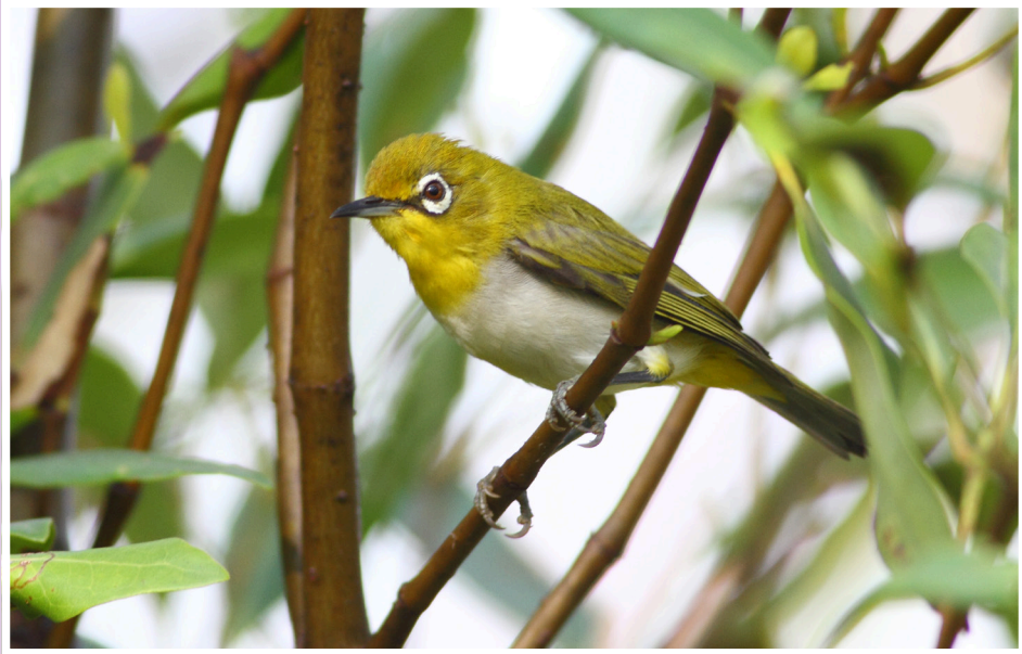
นกแว่นตาขาวสีทอง : Oriental White-eye : Zosterops palpebrosus