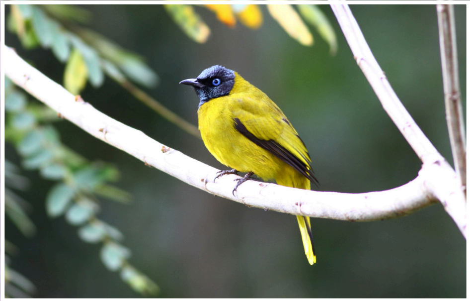
นกปรอดทอง : Black-headed Bulbul : Pycnonotus atriceps