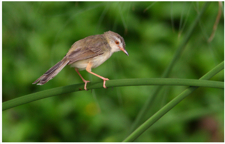
นกกระจิบหญ้าสีเรียบ : Plain Prinia : Prinia inornata