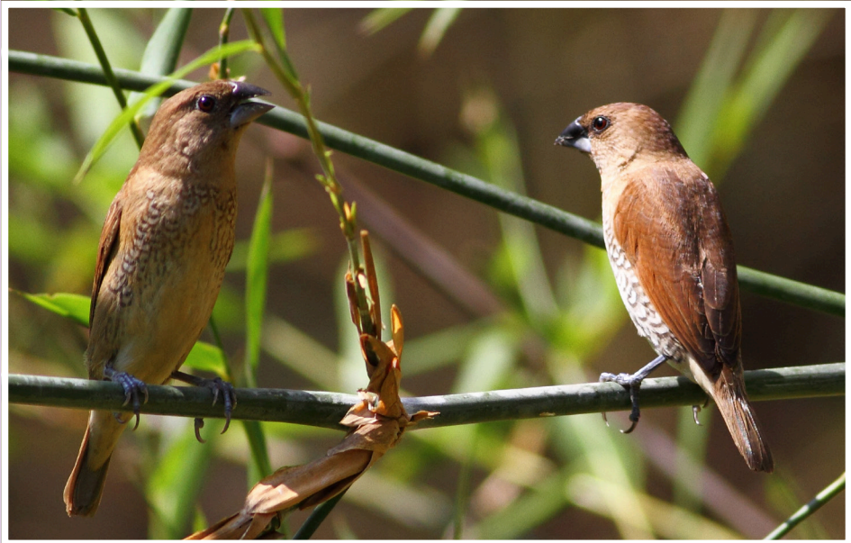
นกกระตีดขี้หมู : Scaly-breasted Munia : Lonchura punctulata