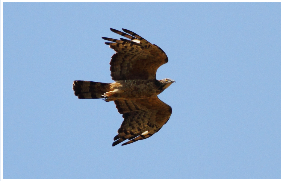
เหยี่ยวผึ้ง : Oriental Honey-buzzard : Pernis ptilorhynchus