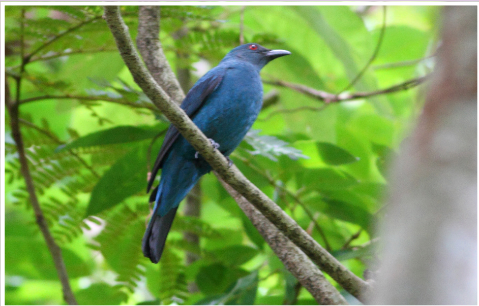
นกเขี้ยวคราม : Asian Fairy-bluebird : Irena puella