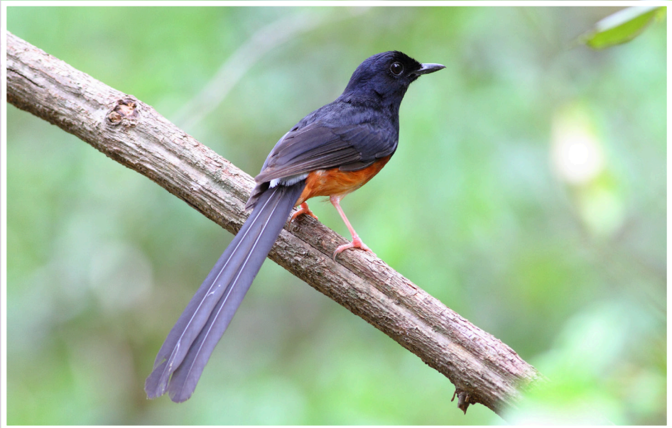
นกกาขงขนดง : White-rumped Shama : Copsychus malabaricus