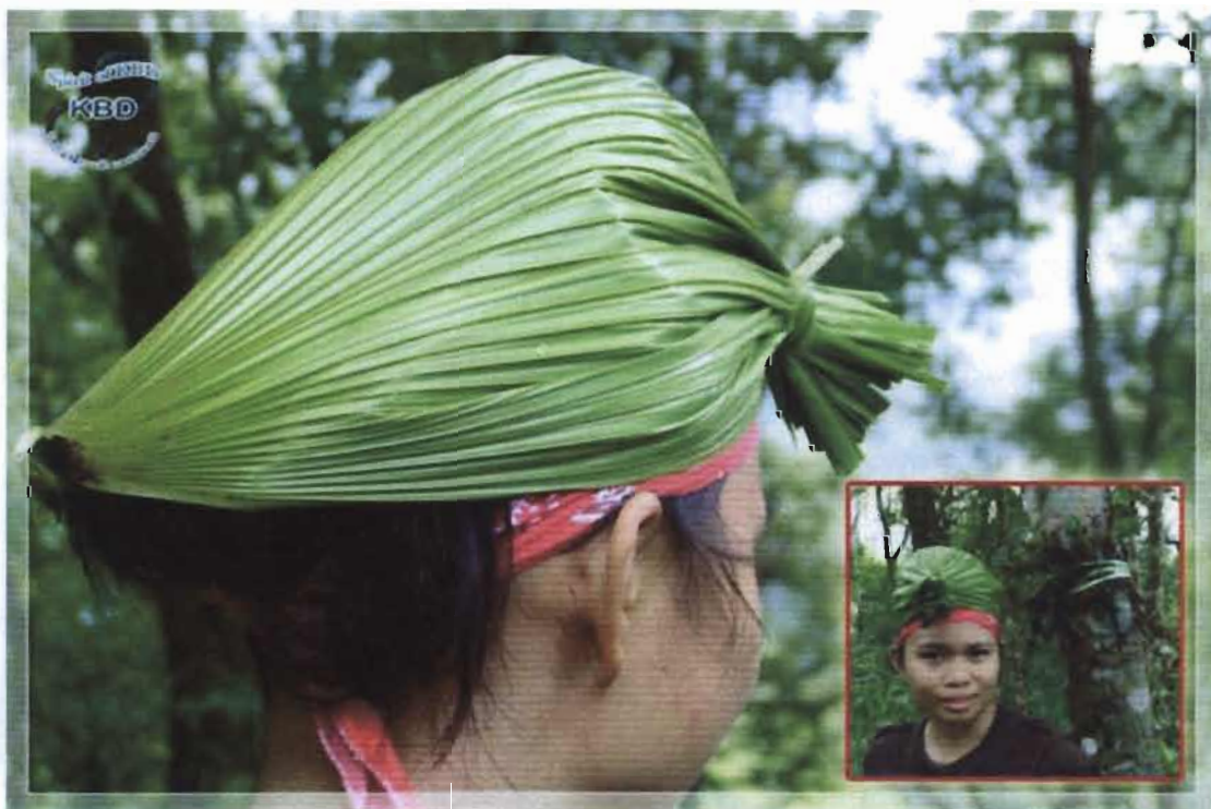
ทำหมวกกันฝน