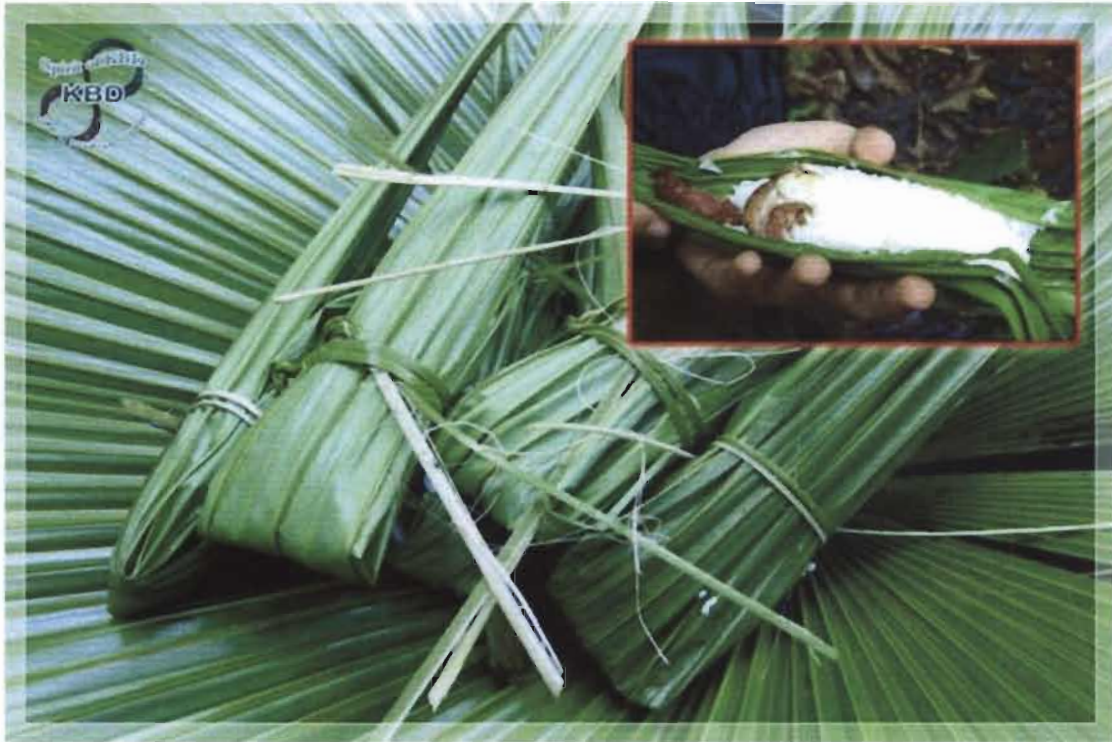
ใช้ห่อข้าวให้อาสาสมัคร