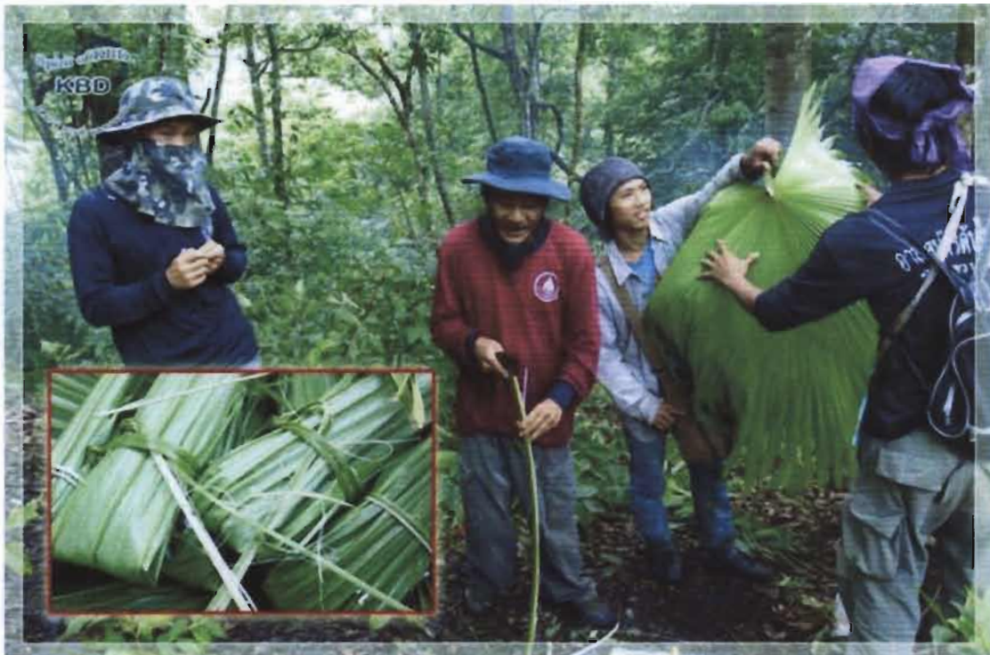
ก้านใบผ่าเป็นตอกใช้มัดห่อข้าว